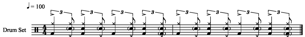
Kuvio 9. Everyday I Have The Blues - kappaleen Intro ja soolo. Nuotinnos Juha Räsänen

Ensimmäisenä kappaleen Intron ja Soolon komppi. Suluissa olevat bassorummun iskut Jordan soittaa soolon alla.