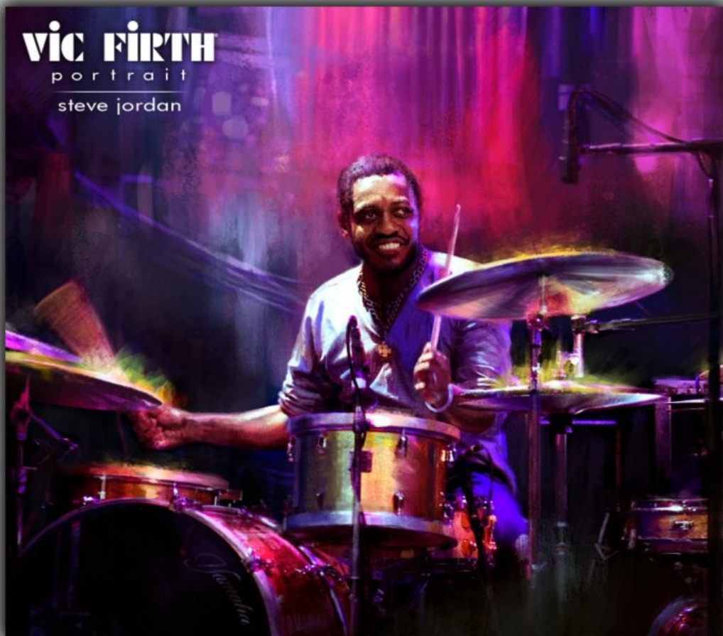
Kuvio 1. Steve Jordan.

Joillakin muusikoilla on selkeästi oma soundinsa ja heidän soittonsa tunnistaa heti. Rumpali Steve Jordan (Kuvio 1.) on yksi heistä. Hänen vahva ja kappaleisiin täydellisesti sopiva rumpujensoittonsa on tehnyt hänestä kysytyn soittajan ja tuottajan ympäri maailmaa. Hänen monipuolinen näkemyksensä musiikkiin on varmasti hänen suurin ja samalla tärkein käyntikorttinsa musiikin alati muuttuvalla kentällä. Jordanin äärimmäisen musikaalista soittoa kuullaan monella maailman myydyimmällä äänitteellä.