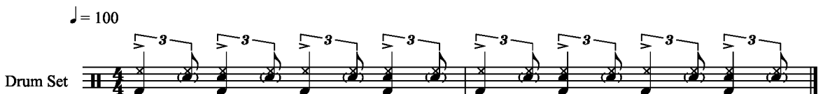
Kuvio 10. Everyday I Have the Blues A-osa. Nuotinnos Juha Räsänen.