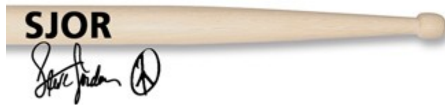
Kuvio 12. Steve Jordan mallin kapula.

Tällöin haluttua tunnelmaa ja/tai soundia haen myös pitämällä kapulasta kiinni eri paikasta. Jordan vaihtelee vasemman kätensä kapulan otetta perinteisen, "traditional grip" ja uudemman "matched grip" välillä. Tämän hän on sanonut johtuvan juuri kappaleen tunnelmasta. Myös oikeankäden kapulalla hän muuttaa kappaleiden tunnelmaa varsin tehokkaasti. The Groove is Here -dvd:llä joissakin esimerkeissä hän pitää kiinni keskeltä kapulaa ja joissakin kapulan päästä. Hänen nimikkokapulansa (Kuvio 12. Vic Firth, Steve Jordan model) on melko pitkä ja ohut, jolloin lyönneissä kuuluu kohtuullisen paljon rumpujen ylä-ääniä. Varsinkin Everyday I Have the Blues -kappaleessa tämän kuulee hienosti rumpujen ollessa viritettynä melko korkeiksi ts. medium vireeseen.