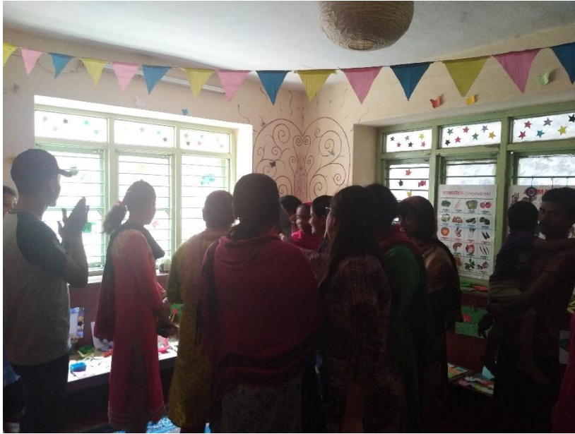
Kuva 1. Tapahtuman valokuvanäyttely