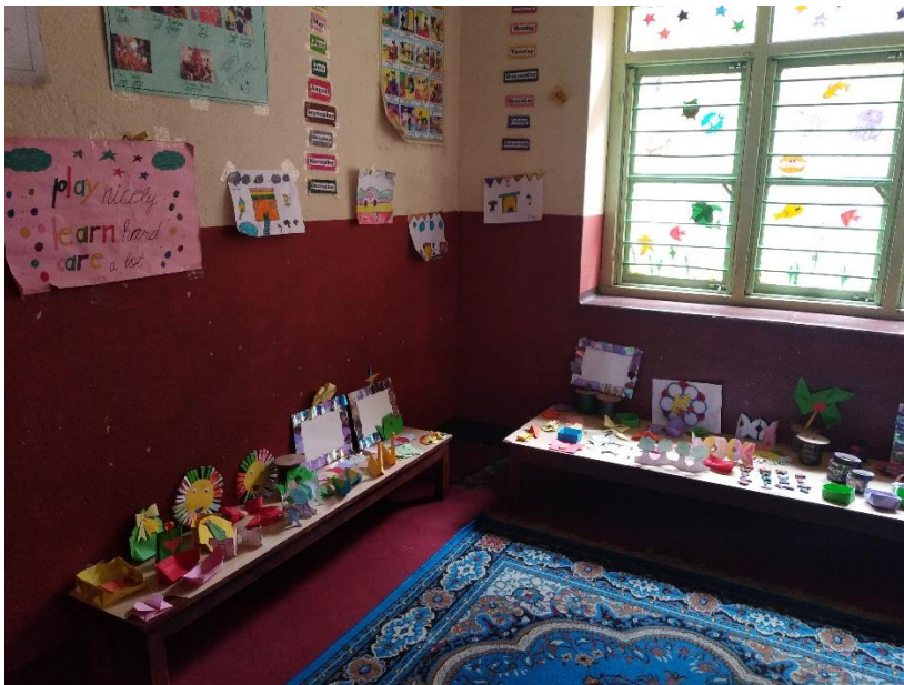
Kuva 2. tapahtuman askartelunäyttely