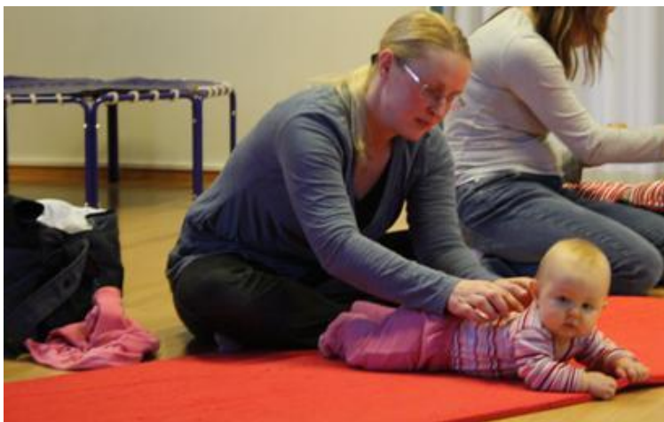
Kuva 2 Vauvahieronta

Kerho alkoi pienellä keskustelulla viime toimintakerrasta, minkälaisia ajatuksia viime tapaamisesta oli jäänyt ja miten äidit kokivat kerhon merkityksen. Äidit kertoivat olleensa tyytyväisiä viime tapaamiseen ja iloitsivat siitä, että saivat viettää kahdenkeskistä aikaa kuopuksen kanssa. Äidit kokivat hyväksi käytännöksi myös sen, että isommilla lapsilla on koko kaksituntisen ajan oma kerhonsa, jotta Naperokerhon ohjatun osuuden jälkeen äideille jää aikaa keskustella keskenään. Lisäksi äidit mainitsivat, että on tärkeää saada mahdollisuus puhua myös vanhemmista lapsista silloin, kun he eivät ole paikalla.