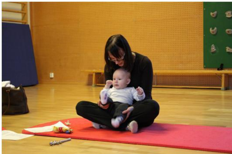
Kuva 7 Muskarihetki

Muskarilauluja oli valittu yhteensä yhdeksän ja ne olivat sellaisia, joissa äiti ja lapsi ovat vuorovaikutuksessa toistensa kanssa kosketuksen ja liikkeen kautta. Äideille jaettiin laulujen sanat, jos he tahtoivat laulaa mukana. Lauoimme ja esitimme laulut ja äidit saivat musisoida samalla vauvojen kanssa. Ensimmäisenä oli aloituslaulu, jossa kerrattiin paikalla olevien vauvojen nimet ja samalla vauvat saivat heiluttaa helistintä äitinsä avulla musiikkia myötäillen. Monet lauluista olivat äideille tuttuja, esimerkiksi Bussilaulu ( pyörät ne pyörivät ympäri... ) joten he pystyivät hyvin keskittymään tuokioon vauvansa kanssa. Viimeiset kaksi laulua olivat hieman rauhallisempia, jossa siliteltiin ja hellittiin vauvaa.