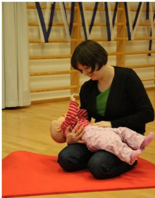
Kuva 5 Harakka huttua keittää

Seuraavaksi oli vuorossa maalaushetki. Äidit riisuiivat lapset vaippoja lukuun ottamatta. Lattialle oli levitetty valkoista paperia, johon sai painaa jälkiä. Äideille annettiin pensselit, joilla he saivat maalata lapsensa kämmeniä ja jalkapohjia. Äidit aloittivat jalkapohjien maalaamisesta pitäen lasta sylissään samalla, kun he levittivät maalia. Kun jalkapohjassa oli tarpeeksi maalia, ohjasi äiti vauvan jalan paperille. Vauvojen ilmeet olivat keskittyneitä ja nauttivia, he tarkkailivat, mitä äiti teki ja ihmettelivät innoissaan jalanjälkeä paperilla. Alussa vauvat vaikuttivat hieman jännittyneiltä, mutta pian he jo innostuivat ja maaliakin näytti leviävän ympäri kehoa. Yksi äideistä ihasteli maaliin sotkeutunutta lastaan ja tokaisi: "Pieni vihreä vauvani" .