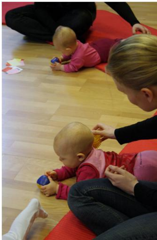
Kuva 1 Hierontahetki

Tämän jälkeen annoimme äideille palautelaput, jotka he saivat täyttää. Kun laput olivat täytetty, kiitimme äitejä tästä toimintakerrasta ja ohjasimme heidät kahvittelemaan. Äidit olivat antaneet palautetta eri määrin: toiset enemmän ja tarkemmin, toiset taas vain muutamain sanoin.