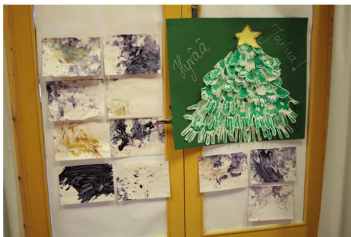
Kuva 8 Vauvojen ja äitien tuotoksia

Viimeinen toimintakerta ajoittui hyvin lähelle joulua, joten halusimme järjestää pienet juhlat kerhon päättymisen ja joulun kunniaksi. Olimme edellisellä kerralla maininneet äideille, että he saisivat tällä toimintakerralla tuoda joitain herkuja mukaan, joita voitaisiin sitten yhdessä maistella kahvihetken aikana. Olimme ripustaneet salin seinälle joulukuusen, joka muodostui aiemmin painetuista äitien ja lasten käden- ja jalanjäljistä. Seinälle oli ripustettu myös ruokaseella tehdyt maalaukset (Kuva 8).