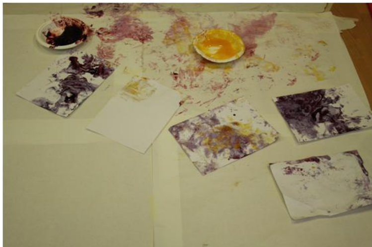
Kuva 4 Tuotoksia