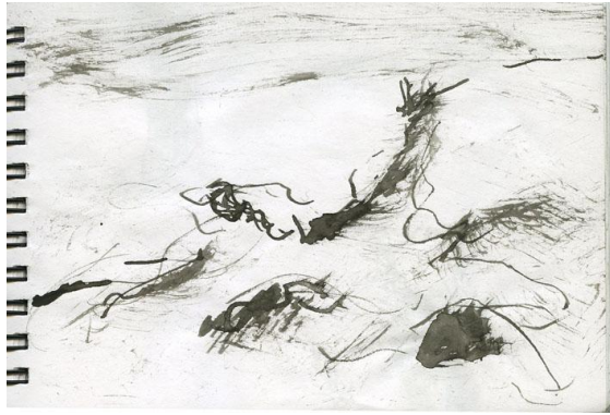
Ikkunan alla on lumi peittänyt kasveja.