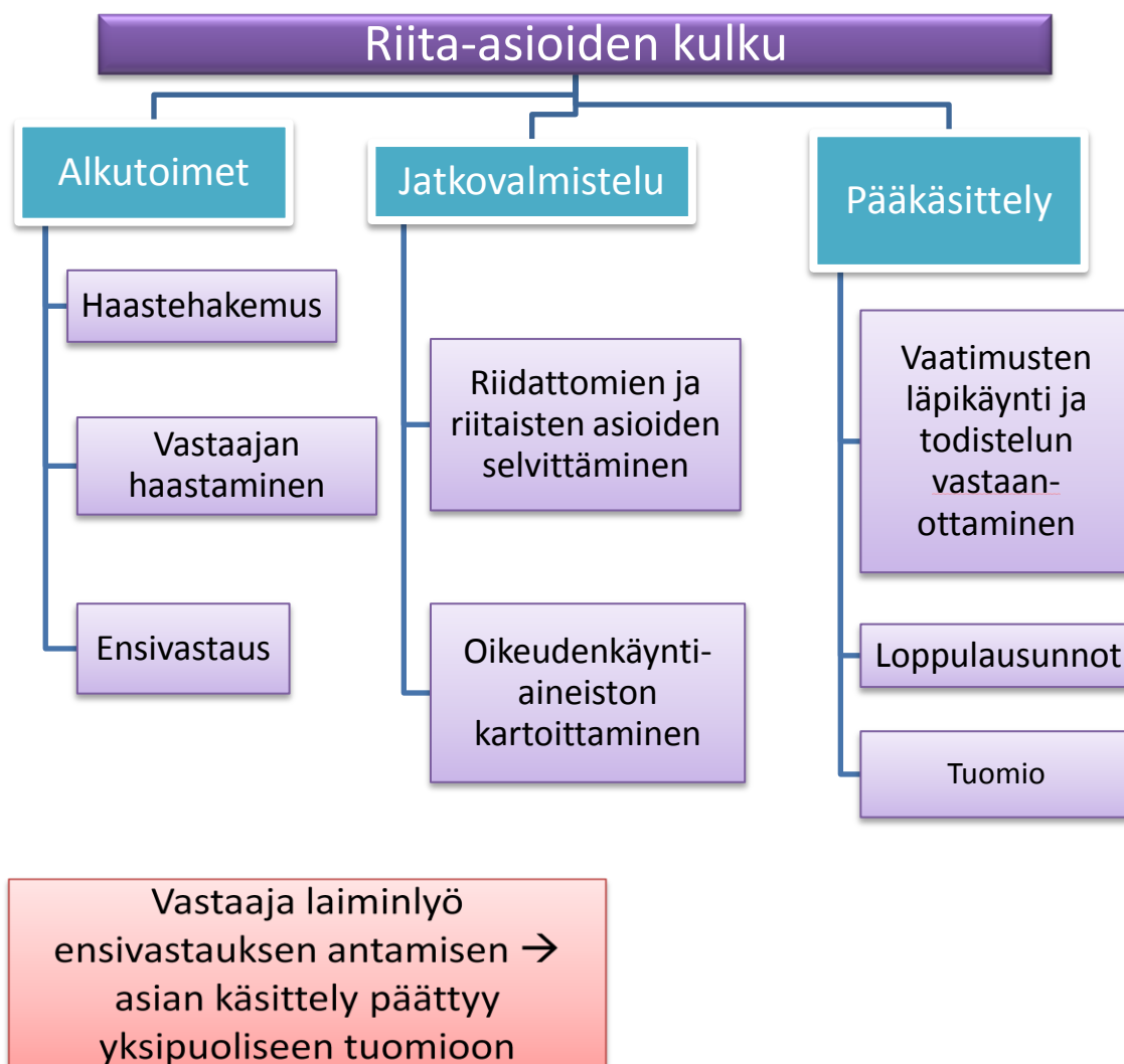
KUVA 2: Riita-asian eteneminen (Havansi 2007, 81-109)

Peruskokoonpanona riita-asioissa voidaan pitää yhden tuomarın kokoonpanoa. Rajaveto yhden tuomarın ja kolmen tuomarın kokoonpanon välillä on vapaampaa riita-asioissa kuin rikosasioissa. Rikosprosessissa asiaa säätelee pitkälti rikoksen vakavuus, kun taas riita-asioissa kokoonpanon suuruus on harkinnanvaraista. Oikeudenkäymiskaassa on lueteltu tapauksia, jotka tulisi istua yhden tuomarın kokoonpanossa, mutta tosiasiallisesti niihinkin pykäliin on poikkeuksia. (Lappalainen 2002, 22-23).