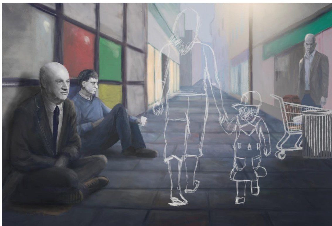
Kuva 1. Poor You, Tiina Rahm, digitaalinen maalaus, 18 x 27 cm, 2019

koska he myös mahdollistavat tällaisen toiminnan. Silti pidän Kevinistä, ja tämä on se syy, miksi hän päätyi taiteeseeni.