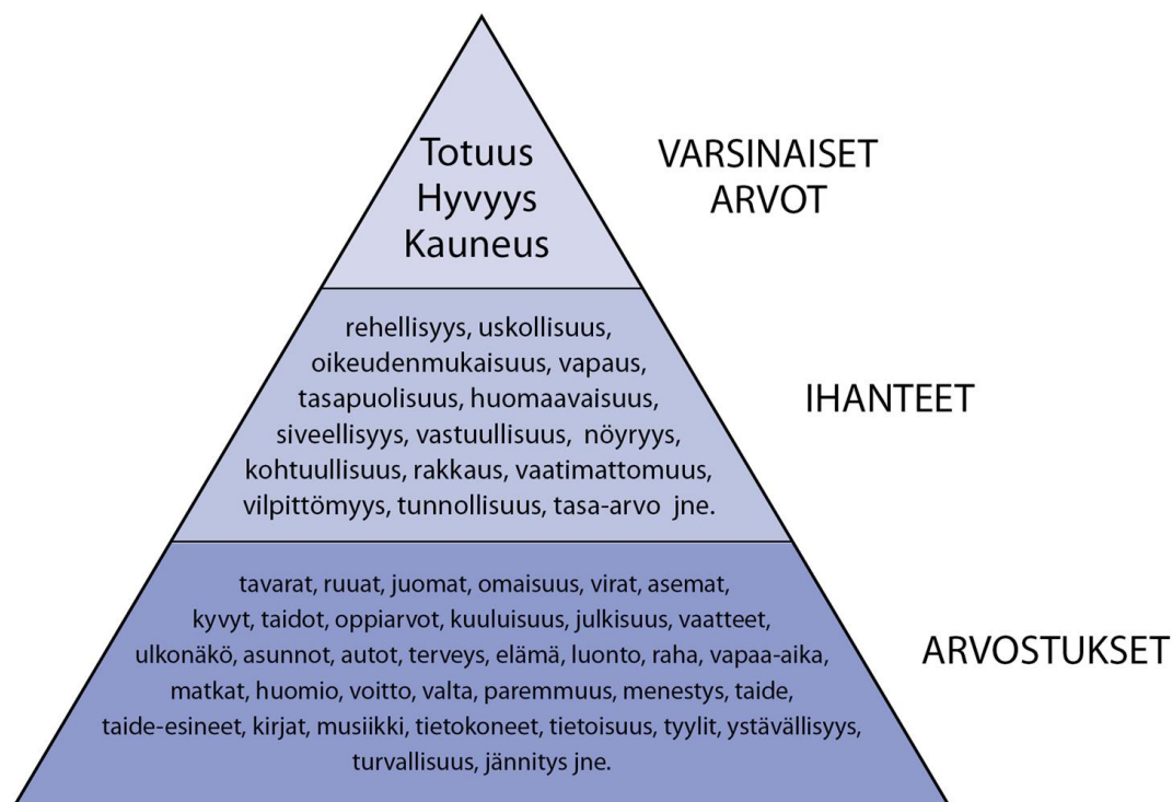
Kuvio 1. Arvojen, ihanteiden ja arvostuksien hierarkia. (Turunen 2018, 56, 88)

Yllä oleva kuvio 1 erittelee varsinaiset arvot, ihanteet ja arvostukset. Muuttumattomat universaalit arvot ovat totuus, hyvyys sekä kauneus. Kolmion alaosassa olevia arvostuksia on ilmeisesti rajaton määrä ja niitä syntyy lisää (Turunen 2018, 89). Anttila (2005, 83) mainitsee, että paljon kiistellään tutkimuksen sitoutumisesta arvopäämääriin, ja esittää kysymyksen, miten tämä tapahtuu. Hänen mielestään tutkimustieto voi olla arvosidonnaista tai arvovapaata, mikä on riippuvaista tutkimuksen lähestymistavasta. Edellä mainitusta voi päätellä sen, että arvoista tiedetään hyvin vähän.