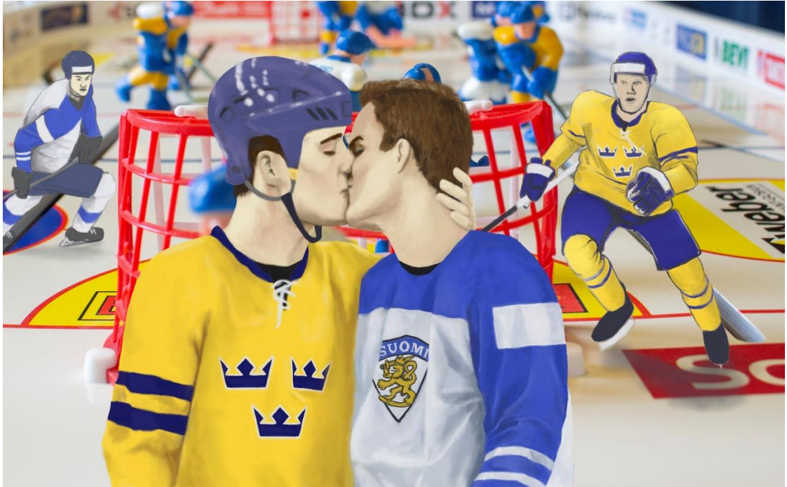
Kuva 4. Poikien leikit, 28 x 46 cm, Tiina Rahm, 2019

Suomi menestyisi kansainvälisesti jossain muussa joukkuelajissa, uskon samalaista romantisoimista muodostuvan kyseisen lajin ympärille.