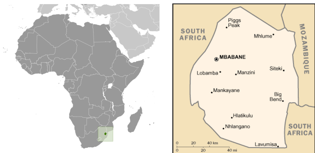
Kuva 1. Karttoja. (Central Intelligence Agency 2009)

Swazimaan kuningaskunta eli Swazimaa sijaitsee eteläisessä Afrikassa Mosabikin ja Etelä-Afrikan välissä. Maan pinta-ala on 17 364 neliökilometriä ja väkiluku on 1 337 186. Väestön keski-ikä on 20.1 vuotta ja eliniän odote 47.85 vuotta. Väestöstä 97 prosenttia on alkuperäisväestöä ja 3 prosenttia eurooppalaisia. Maan pääkaupunki on Mbabane, tosin hallinnollinen ja kuninkaallinen keskus sijaitsee Lobambassa. Manzini on Swazimaan suurin kaupunki, jonka alueella asuu noin 25 prosenttia koko Swazimaan asukkaista. Manzinin alue on maan suurin teollisuusalue. (Central Intelligence Agency 2009).