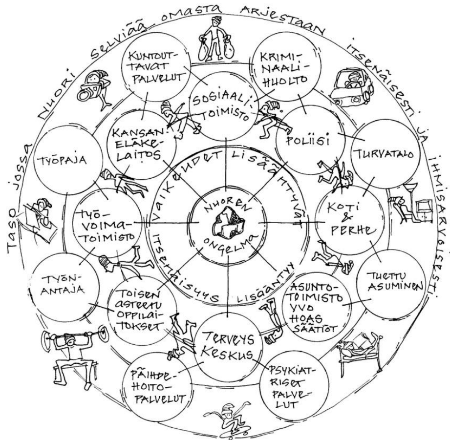
KUVA 1 Heitä kivi veteen ja kysy miksi on aina tehty näin. Kuvaan tässä vanhaa kehämallia, jossa nuoret auttamisverkostossa juoksevat "luukulta" toiselle. Työskentely nuoren kanssa on ongelmakeskeistä. Esittelen myöhemmin uuden kehämallin.