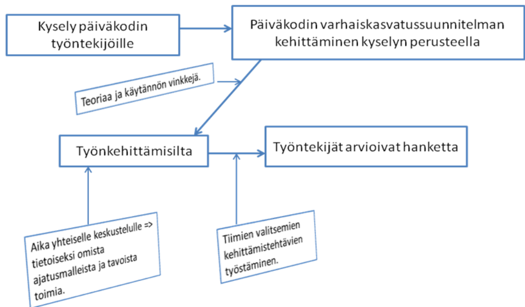
KUVIO 1. Tutkimuksellisen kehittämishankkeen vaiheet.

Viimeinen vaihe on loppuraportin eli opinnäyteyön valmistuminen. Kehittämiss-hankkeen eri vaiheiden materiaaleista on kerätty päiväkodille materiaalikansio, joka on jatkossa kaikkien yhteisessä käytössä.