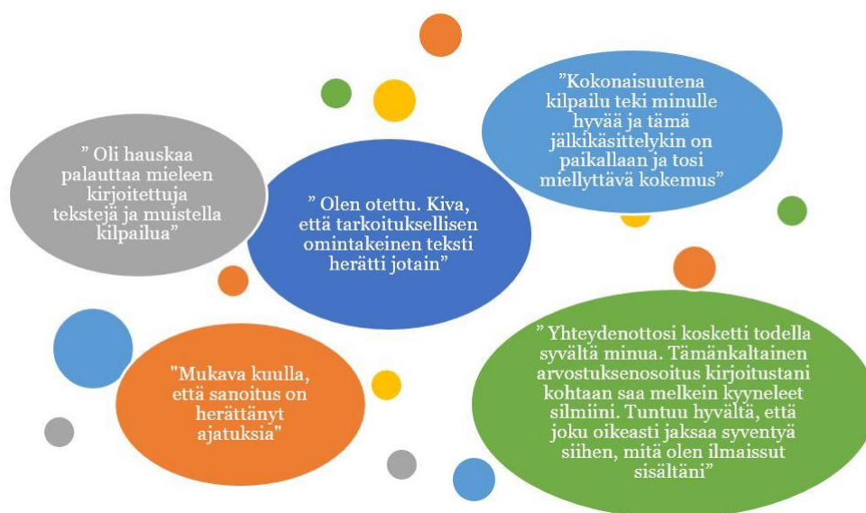
Kuvio 7 . Haastateltavien kokemuksia haastattelusta.

Totesin aiemmin, että haastatteluaineistoni mukaan kirjoittaminen yhdisti jokaista sanoittajaa, mutta yhdistävänä tekijänä löytyi melkein jokaisesta vastauksista esiin nouseva innostus vastata haastattelupyyntöön sekä kertoa omia ajatuksiaan liittyen sanoitettuun tarinaan. Vastaajat olivat kiitollisia, että olin kiinnostunut heidän sanoitusten taustatarinoista sekä ajatuksista, mitä liittyi sanoittamisprosessiin. Suurin osa haastateltavista vastasi kysymyksiin melkein saman tien ne saatuaan ja he toivat esiin erilaisia näkökulmia opinnäytetyöhöni liittyviin teemoihin. Osa haastateltavista innostui käymään näistä aiheista sähköpostitse pitkiäkin ajatuksen vaihtoja. Esittelen kuviossa numero 7 muutamia sanoittajien kokemuksia haastatteluista.