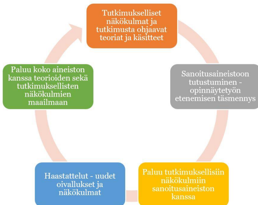
Kuvio 1. Opinnäytetyön prosessin eteneminen.

Hermeneuttinen kehä kuvastaa hyvin myös opinnäytetyöni etenemistä, jota kuvaan kuviossa 1.