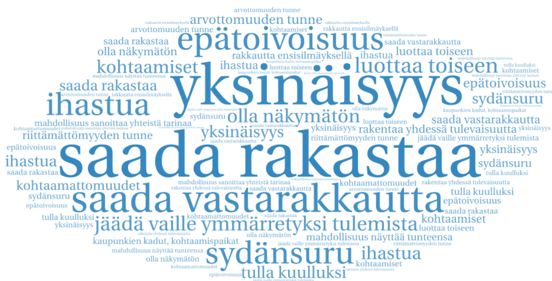
Kuvio 3. Sanapilvi sanoitusten sisällöistä.

Tunne hyväksytyksi tulemisesta ja kokemus kuulumisesta ovat jokaisen yksilön perus- tarpeita. Ne ohjaavat myös yksilöiden tapaa ajatella kuka minä olen ja mihin minä kuu- lun, eivätkä ne voi olla vaikuttamatta kokonaisvaltaisesti hyvinvointikokemuksiin. (Ni- vala & Ryyänen 2019, 142.) Joistain sanoituksista ikään kuin loistaa se kaipaus kuu- lumisesta ja hyväksytyksi tulemisesta juuri sellaisena kuin itse on. Jotkut tarinat taas johdattelevat lukijaansa syvän kiintymyksen ja rakkauden tunteiden äärille, jolloin myös kaupunkien paikat sekä tapahtumat näyttäytyivät tarinoissa positiivisina sekä merkityksellisinä.