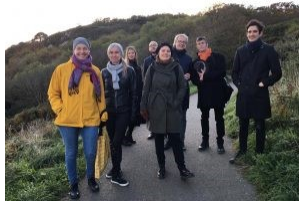
PARTGO-työryhmä yhteistyön rakentamisen maisemissa Dublinissa lokakuussa 2019.

Yksi parhaillaan käynnissä olevista hankkeista on PARTGO, Digital and Critical Views on Public Art Pedagogy. Se on kansainvälinen julkisen taiteen pedagogiikan kehittämiseen tähtäävä Erasmus + -rahoitteinen hanke, jota Turun ammattikorkeakoulu koordinoi vuosina 2019–2022. PARTGO-hankkeeseen osallistuu kuvataiteen kouluttajia Irlannista ( NCAD ), Unkarista ( MOME ) ja Virossa ( EKA ). Päätaavoitteena on tutkia ja kehittää julkisen taiteen koulutusta Euroopassa. Tavoitteisiin päästään pienimuotoisen tutkimuksen, pilottimoduulien ja julkisen taiteen konseptien avulla.