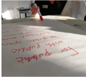
Taina Erävaara Dublinissa PARTGO-tapaamisessa lokakuussa 2019.

"Hyvin järjestetty ja onnistunut käynnistystapaaminen vaikuttaa merkittäväällä tavalla siihen, että kaikki yhteistyökumppanit voivat kokea työskentelyn mielekkääksi."