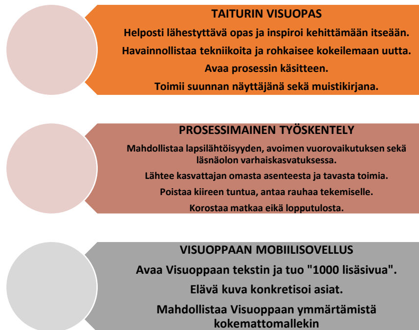
Kuvio 3. Visuoppaan ja sen mobiilisovelluksen merkitys varhaiskasvatuksessa.

vasta-alkajalle tai henkilölle, joka kaipaa tukea ja ideoita visuaalisten taiteiden opetukseensa varhaiskasvatuksessa. Kuvio 3 ilmentää visuoppaan ja sen mobiilisovelluksen merkitystä varhaiskasvattajille. Huomioidessamme haastateltujen omat taidokokemukset ja harrastuneisuus, on helppo ymmärtää uusien lisävinkkien tarpeellisuus.