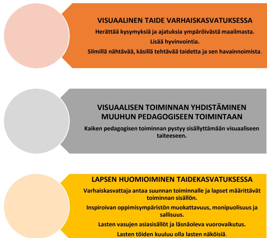
Kuvio 2. Visuaaliset taiteet ja niiden toteuttaminen varhaiskasvatuksessa.

mustuloksemme osoittavat, että visuaaliset taiteet on helppo yhdistää muuhun pedagogiseen toimintaan lasten henkilökohtaiset varhaiskasvatussuunnitelmat huomioiden. Kuvio 2 ilmentää varhaiskasvattajien käsityksiä visuaalisista taiteista sekä niiden toteutuksesta varhaiskasvatuksessa.