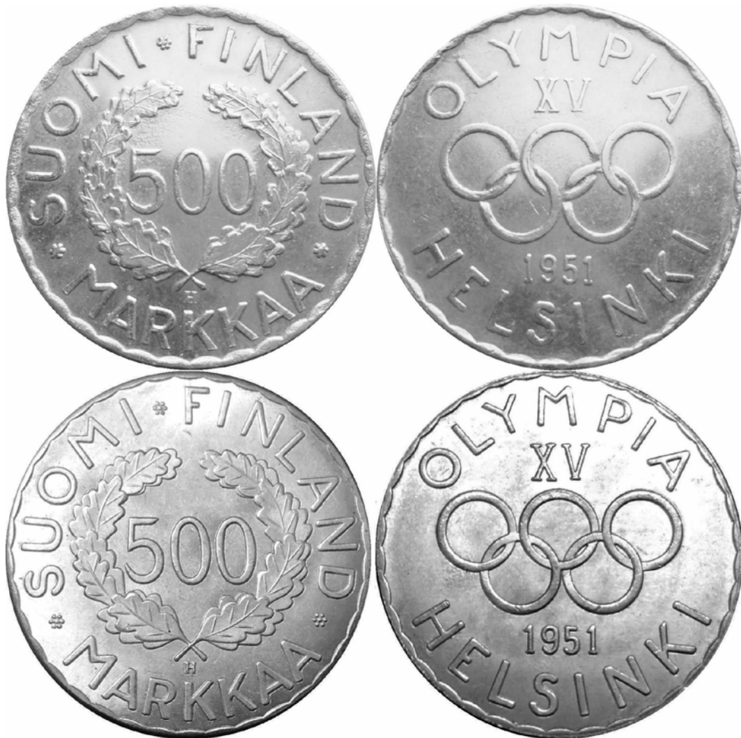
Kuva 5. Aito ja väärä 500 markan olympiaraha vuodelta 1951. Ylinnä aito raha, alinna tekele. Huomatkaa rahojen pettävä samankaltaisuus. Tekeleestä on kaupan COPY-stanssattuja ja stanssaamattomia versioita. Kuvien yhdistely ja muokkaus Jorma Impola SeAMK.

tekelerahojen arvo- ja tunnuspuolet ovat mitä mainiota laatua. Vain pieni ero arvopuolen tekstin jakavissa ruusukkeissa paljastaa väärennöksen. Mutta vain vilkaisu rahan reunaan kertoo, onko kyseessä aito vaiko kiinalaisten tekemä raha – aidossa rahassa on toistuvana kuviointina kalevalaiset kädet, kun taas tekeleissä on rihlattu reuna.