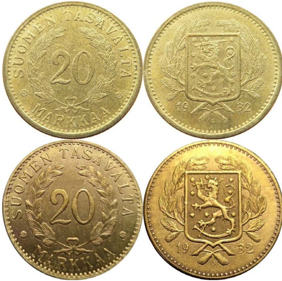
Kuva 2. Aito ja väärä 20 markan raha 1932. Ylinnä aito raha, alinna tekele. Huomatkaa rahojen pettävä samankaltaisuus. Tekeleestä on kaupan COPY-stanssattuja ja stanssaamattomia versioita.