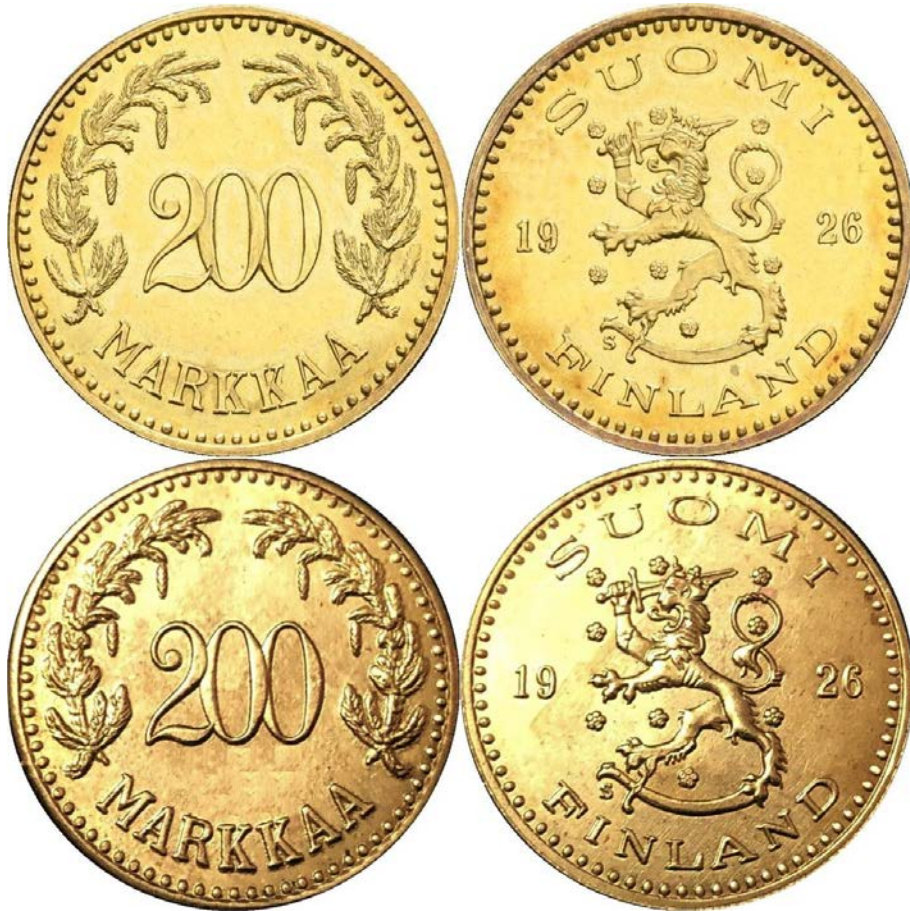
Kuva 9. Aito ja väärä 200 markkan kultaraha vuodelta 1926. Ylinnä aito raha, alinna tekele. Huomatkaa tekeleen heikompi laatu, erityisesti kirjainten ja numeroiden ”pulleus” ja epätarkkuus aitoihin verrattuna, mikä onkin ainoa selkeä ero aidon ja tekeleen välillä. Tekeleitä on myös saatavana kullattuina. Tekeleestä on kaupan COPY-stanssattuja ja stanssaamattomia versioita.