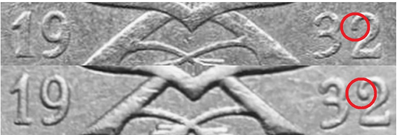
Kuva 3. Aidon ja väärän 20 markan rahan vuosilukujen 19 32 yksityiskohtien vertailua. Ylinnä aidon rahan, alinna tekeleen vuosiluku. Huomatkaa punaisten havainneympyröiden korostama ero