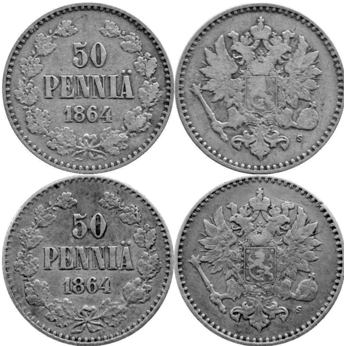
Kuva 1. Vuoden 1864 50 pennin hopearahojen vertailua. Ylempänä tavallinen tyyppi, alempana havaittu uusi variantti.

Asia vaati tutkimista, ja perehdyin olemassa olevaan kuvamateriaaliin kyseisistä 50-pennisistä, ja kuinkas ollakaan, selkeä poikkeama löytyi!