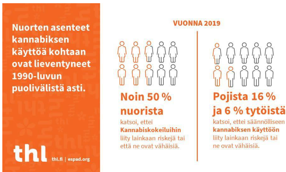
Kuva 2. Nuorten asenteet kannabista kohtaan.