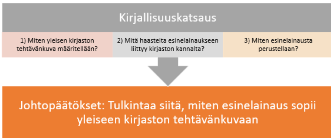
KUVIO 1. Työn menetelmän kuvaus

Luvussa Johtopäätökset pyrin aikaisempien lukujen sisältöihin eli kirjallisuuskatsaukseen vedoten muodostamaan vastauksia varsinaiseen tutkimusongelmaan esinelainauksen sopivuudesta yleiseen kirjastoon. Kuvailevan kirjallisuuskatsauksen periaatteiden mukaisesti tavoitteena on vertailla valittua aineistoa, analysoida olemassa olevan tiedon vahvuuksia ja heikkouksia sekä tehdä laajempia päätelmiä aineistosta (Kangasniemi ym. 2017, 296). Työn sisältö kokonaisuudessaan on esitetty kuviossa 1.