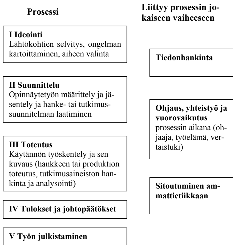
KUVIO 2. Tutkimus- ja kehittämisprosessi

Opinnäytetyöprosessi etenee pääkohdiltaan yleisen tutkimus- ja kehittämisprosessin mukaisesti riippumatta siitä, minkä muotoisena (kehittämishanke, produktio, empiirinen tutkimus) työ toteutetaan. Näin opinnäytetyöprosessin vaiheet voidaan ryhmitellä kuvion 2 mukaisesti: