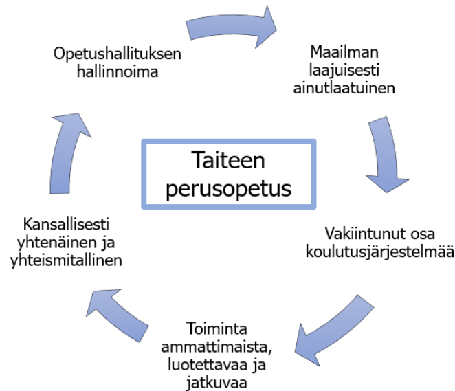
KUVIO 4. Taiteen perusopetuksen erityispiirteitä.

Työn keskeisenä tarkastelukohteenä oli tanssin perusopetuksen näkökulma. Tanssin perusopetus on yksi yhdeksästä taiteenalasta, jotka kuuluvat taiteen perusopetuksen alle. Tanssitaiteen perusopetuksen lähtökohtana on tanssikasvatuksen tarjoaminen harrastajille pitkäjänteisesti niin, että samalla kehitetään valmiuksia tiedollisesti ja taidollisesti. Tanssin perusopetuksen opetussuunnitelmien perusteiden pyrkimys on myös tarjota tanssikasvatuksella myönteisiä kokemuksia tanssin parissa, tukea kokonaisvaltaista kasvua ja vahvistaa oppilaan taiteellista ilmaisukykyä opintojen aikana. Kuten tanssin perusopetuksen tavoitteista näkyy, tarkoitus on siis tarjota tanssikasvatusta niin, että tuetaan oppilaan kasvua kokonaisvaltaiseksi ihmiseksi. Kyse ei ole siis pelkästään taidon opettamisesta, vaan opetuksella pyritään olemaan tukena oppilaan kasvussa ja kehityksessä sekä samalla tarjoamaan myönteisiä kokemuksia. Luovuuden ja taiteellisen ilmaisun tukemisella viitataan myös oppilaan oman taiteellisen äänen löytämiseen, joka on yksilöllinen ja ennalta määrittämätön. Tämä lähestymistapa poikkeaa aiemmin vallalla olleista tanssin alan oppimiskäsityksistä, joissa toiminta oli usein opettajalähtöisempää ja perustui opettajan ennalta määrittämään käsitykseen tanssista sekä opetuksen ja toiminnan sisällöistä.