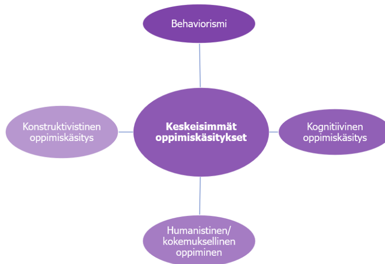
KUVIO 2. Keskeisimmät oppimiskäsitykset

yleisesti tunnettuja oppimiskäsityksiä ja niiden käsitystä niin oppimisprosessista kuin opettajan ja oppijan rooleista. Keskeisimmät oppimiskäsitykset esitellään kuviossa 2.