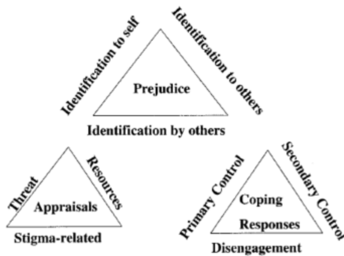
FIG. 2.1. Stress and coping model.

prejudice), stressitekijöiden ja omien selviytymiskeinojen arviointiin (appraisals), ja stressin hallintaan (coping). (Levin ym. 2005, 26.)