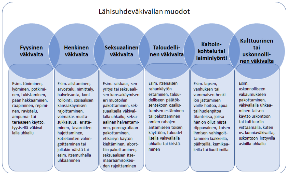
Kuvio 1: Lähisuhdeväkivallan muodot (THL 2018).

Suomessa lähes joka toinen nainen on elämänsä aikana kokenut fyysistä tai seksuaalista väkivaltaa tai molempia. Kyselytutkimusten mukaan naisista ja miehistä suunnilleen yhtä moni on kokenut parisuhdeväkivaltaa, mutta vakava väkivalta kohdistuu useammin naisiin ja naiset saavat väkivallasta miehiä enemmän ja vakavampia vammoja. (Nollalinja 2018.) Vuonna 2018 viranomaisten tietoon tulleissa lähisuhdeväkivaltarikoksissa oli Tilastokeskuksen mukaan 9 900 uhria ja naisten osuus heistä oli 76,5 prosenttia. Uhreista 7 400 oli aikuisia ja 2 400 alle 18-vuotiaita. (Tilastokeskus 2020.)