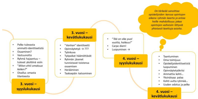
Kuvio 3. Ryhmän ilmiöt kolmantena ja neljäntenä opiskeluvuotena.

Opettajatuutorit havaitsivat, että ryhmien ilmiöt toistuvat vuosikursseilla koulutusalaista riippumatta. Tästä työpajassa toteutetusta jäsenyyksestä on ollut hyötyä myös koulutuksen suunnittelussa. Käytimme esimerkiksi media-alan koulutuksen vuoden 2020 oppimissuunnitelman rakentamisessa pohjana ryhmän eri vaiheisiin liittyviä havaintoja, ja pyrimme huomioimaan opintojaksojen ja -sisältöjen sijoittelussa sen, että opiskelija kokee olevansa kiinnittynyt opintoihinsa koko opiskelun ajan.