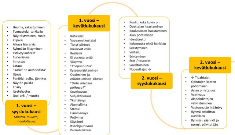
Kuvio 2. Ryhmän ilmiöt ensimmäisenä ja toisena opiskeluvuotena.

Miös ryhmien dynamiikka ja erilaiset ryhmäilmiöt herättivät kysymyksiä ja huolta opettajatuutoreiden keskuudessa. Taideakatemialle sekä terveyden ja hyvinvoinnin opettajatuutoreille suunnitellussa koulutuksessa kiinnitimme ohjaajien huomion siihen, että monet ryhmässä tapahtuvat ilmiöt ovat luonnollisia ja liittyvät ryhmädynamiikkaan ja ryhmäytymisen vaiheisiin. Järjestimme työpajan, jossa opettajatuutorit pohtivat opiskelijaryhmän opintojen kaarta vuosi kerrallaan. Tavoitteena oli koota kokonaisvaltaisesti ilmiöitä, jotka näyttäytyvät kullakin vuosikursilla. Alla olevat kuviot (kuviot 2 ja 3) ovat opintopsykologi Laura Tätilän ja työpajan ohjanneen lehtori Marja Suden koosteja työpajoissa syntyneistä havainnoista.