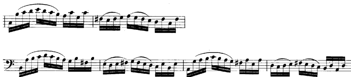
NUOTTIESIMERKKI 1. Sekvenssejä tahdeista 7-12. J. S. Bach, BWV 1009, Prelude.