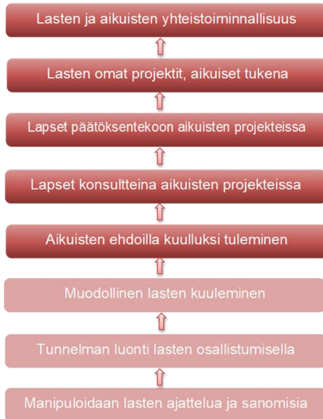
Kuva 1. Hartin (1992) Osallisuuden portaat -malli (Turja 2011, 27)

mahdollisuus tehdä itse aloitteita ja suunnitella toimintaa ja aikuiset ovat tässä apuna. Mallin kolme alinta tasoa eivät liity suoraan osallisuuteen, vaan niillä kuvataan sitä, kun aikuiset johdattelevat lasten ajatuksia. (Turja 2011, 27 - 28.)