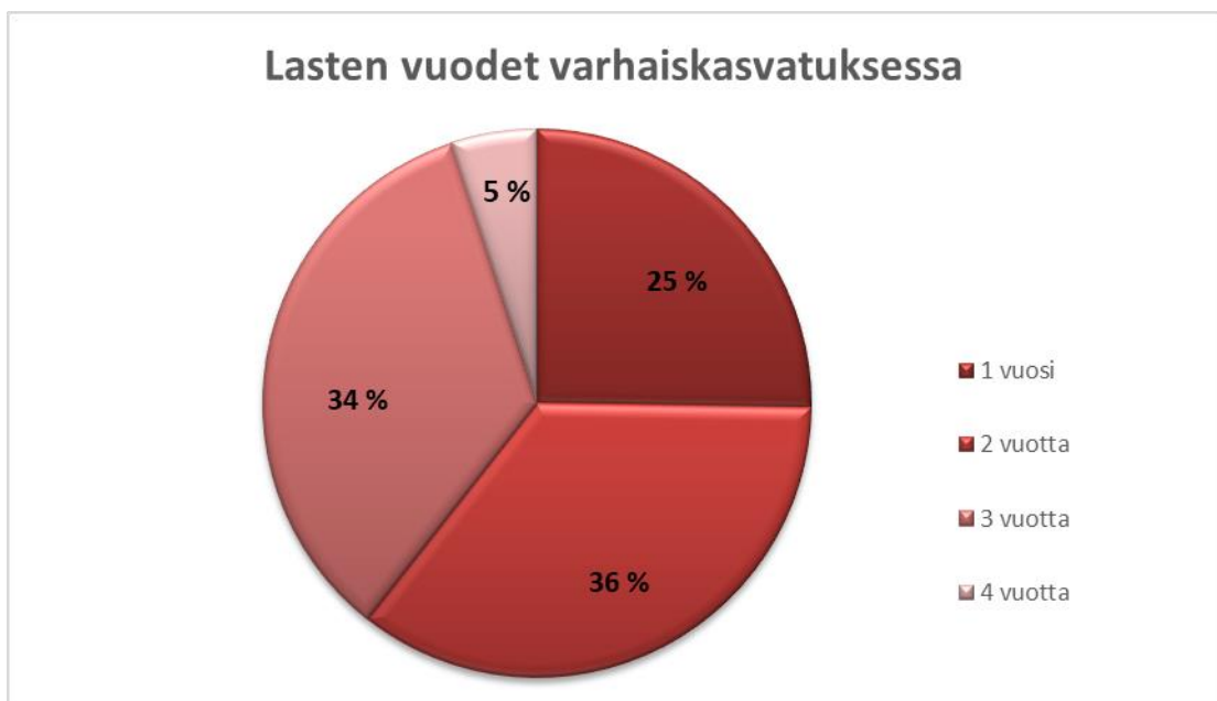
Kuva 2. Lasten vuodet varhaiskasvatuksessa

Kyselyn pystyi palauttamaan vastaamatta kaikkiin kysymyksiin. Kyselyitä palautuikin niin, että jokaisessa kysymyksessä ei ollut kaikkien huoltajien vastausta. Vähiten vastaajia oli kysymyksessä ”Miten yhteistyötä teidän ja päiväkodin henkilökunnan välillä voisi parantaa?”, jossa vastaajia oli 14. Vain kysymykseen ”Oletko äiti, isä vai muu huoltaja?” oli vastattu 22 kertaa. Vastaajista 3-vuotiaiden lasten huoltajia oli kuusi (28 %), 4-vuotiaiden lasten huoltajia oli 10 (48 %) ja 5-vuotiaiden lasten huoltajia oli viisi (24 %). Kuvassa 2 on vertailtu lasten varhaiskasvatusvuosien määrää.