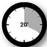
Tutkimuksen keston ennakointi

ennakoinnista hyötyvät useat muutkin potilasryhmät, kuten lapset ja kehitysvammaiset.