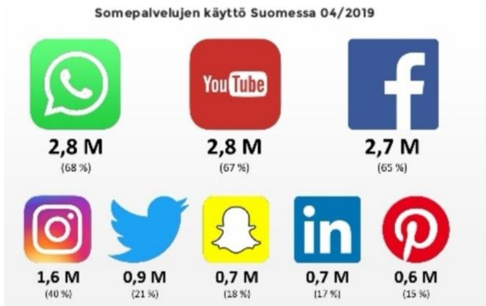
KUVA 1. Somepalveluiden käyttö Suomessa 04/2019. (Innowise. Sosiaalisen median tilastot ja trendit: somekatsaus 2019. Datalähde: DNA ja Nepa. Digitaalinen yhdenvertaisuus Suomessa. 25.3.2019, yli 15-vuotiaat. N= 1029. SVTin Väestötiedot 2018 (stat.fi).)