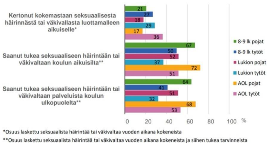
KUVIO 2. Seksuaalisesta häirinnästä tai väkivallasta kertoneiden ja siihen tukea saaneiden nuorten osuus sukupuolen ja koulutusasteen mukaan vuonna 2019. (THL 2019. Lasten ja nuorten hyvinvointi – Kouluterveyskysely 2019, 8. THL – Tilastoraportti 33/2019. Kuvakaappaus.)