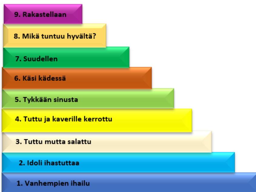
KUVIO 1. Seksuaalisuuden portaat

Viimeisellä portaalla ollaan valmiita yhdyntään Rakastellaan-portaalla. Noin 16-25-vuotiaan pitäisi tässä vaiheessa osata yhdistää yhdyntä muun muassa rakkauden ja läheisyyden tunteisiin, sekä kokea niin psyykkistä kuin fyysistäkin mielihyvää. Nuori myös kykenee huolehtimaan seksuaaliterveydestään esimerkiksi käyttämällä ehkäisyä. (Cacciatore & Korteniemi-Poikela 2010, 21, 136-139.)