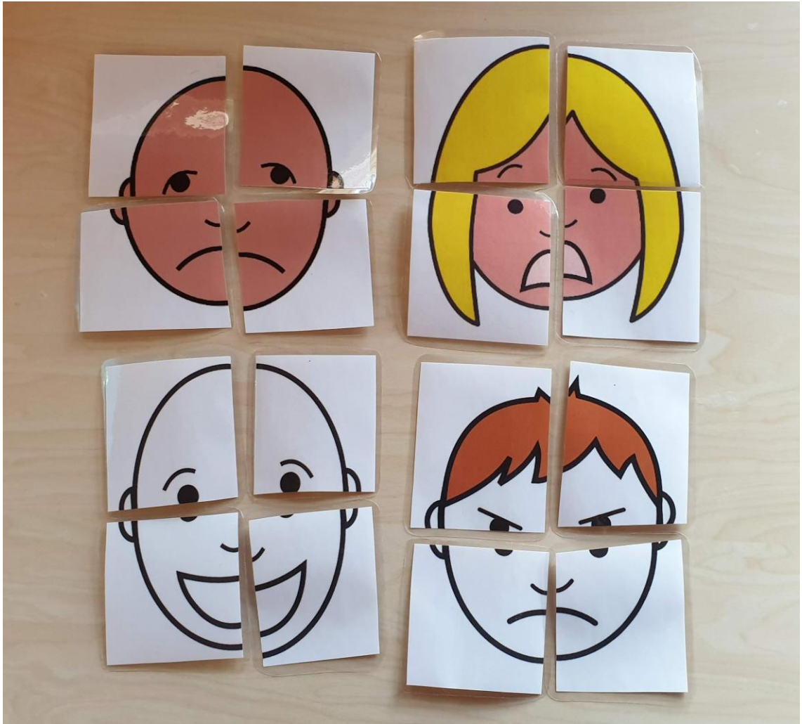
Kuva 8. Tunnekorteista tehdyt palapelit.