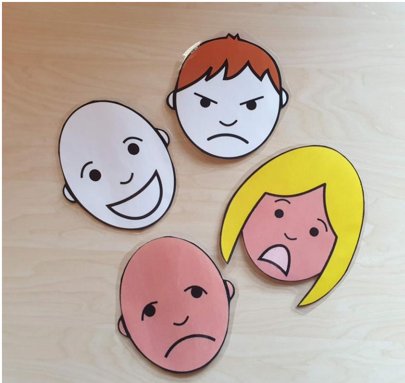
Kuva 1. Tunnekasvatustuokioissa käytetyt tunnekortit. (Palao n.d.)

Tervetuloa kaikille avoimiin tunnekasvatustuokioihin! Tuokiot järjestää Metropolia ammattikorkeakoulun sosionomiopiskelijat osana opinnäytetyötään.