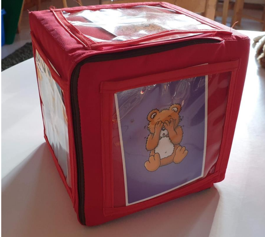
Kuva 5. Tunnenoppa.