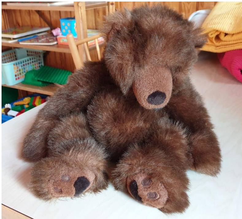
Kuva 3. Tunnekasvatustuokioissa käytetty Nallekarhu pehmolelu.

sanoa ääneen, miltä hänestä tuntui. Halusimme osallistaa lapsia heti ensimmäisestä ohjaukerrasta lähtien ja lapset saivat keksiä nallelle nimen. Lapset antoivat nallelle nimeksi Nallekarhu. Nallekarhu kiersi jokaisen lapsen kohdalla ja lapset saivat vuorotellen esittäytyä Nallekarhulle.