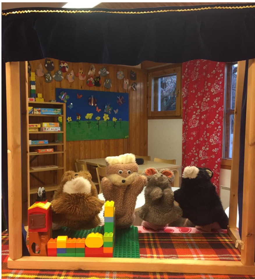
Kuva 6. Nukketeatteri.

Koska aikaa oli vielä tuokiolla jäljellä ja lapset vaikuttivat virkeiltä, laulettiin tuokion lopuksi jo tutuksi tullut Kielinupun “Miltä tuntuu nallesta?” -laulu ja viitottiin yhdessä lasten kanssa laulun tunteet. Toiston avulla lapset oppivat tehokkaasti ja tunnelaulun tuttuuden vuoksi lasten mielenkiinto säilyi tuokioon loppuun saakka. Lopuksi Nallekarhu vilkutti ja lapset hyvästelivät Nallekarhun.