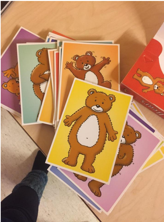
Kuva 4. The Bears nalle-tunnekortit.

Jähmettyneet tunteet -leikin jälkeen heitettiin tunnenoppaa. Tunnenoppa oli iso pehmustettu kuutio, jonka jokaisella sivulla oli muovitasku, johon sai laitettua tunnekortteja. Jokainen lapsi sai vuorollaan heittää suurta noppaa, jonka sivuille oli laitettu erilaisia tunnekuvia. Tunnekuvina oli nalleaiheiset tunnekortit, jotka sopivat nalle -teemaan. Kun lapsi heitti noppaa, katsoimme yhdessä nopan esittämän tunnekuvan ja annoimme lapsen nimetä nopan näyttämän tunteen. Pohdimme myös yhdessä lapsen kanssa, miten tunne ilmaistaan omalla keholla. Tavoitteena oli toiminnallisesti harjoitella tunteiden nimeämistä, tunnistamista ja ilmaisua. Tunnekuvat olivat molemmissa leikeissä tuke- massa lasten tunteiden tunnistamista ja ilmaisua.