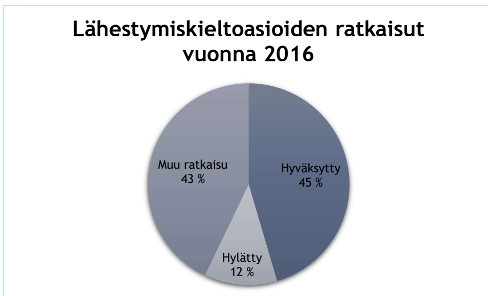
Kuvio 2: Lähestymiskieltohakemuksen pääpiirteinen sisältö