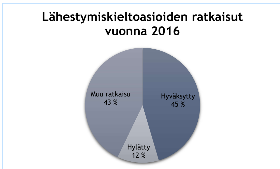
Kuvio 1: Lähestymiskieltoasioiden ratkaisut 2016 (Haapakangas 2017).

Vuodesta 2016 lähtien lähestymiskieltoasiasta on peritty oikeudenkäyntimaksu 250 euroa, mikäli lähestymiskieltoa ei määrätä. Tämä on todennäköisin syy lähestymiskieltohakemusten määrän laskuun. Ero on huomattavissa vuoden 2009 jolloin hakemuksia on toimitettu yhteensä 3227 ja 2016, jolloin hakemuksia on toimitettu 2576 välillä. Alla olevasta kuviosta 1 voidaan havainnollistaa 2016 vuoden tilastotietojen avulla sitä, miten lähestymiskieltoasioiden ratkaisu jakautuu. 59