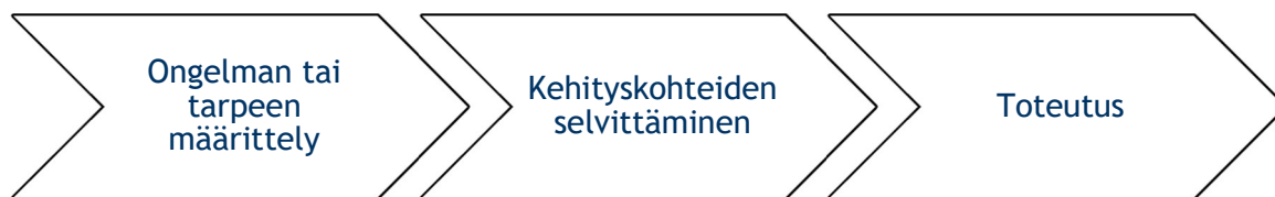
Kuvio 4 : Oikeusmuotoiluprosessi 75 .

Kuvio 4 kuvaa oikeusmuotoiluprosessia yksinkertaisimmillaan. Vaikka oikeusmuotoilu voidaan ymmärtää monin eri tavoin, tässä opinnäytetyössä sitä hyödynnetään pelkistetysti. Oikeusmuotoilussa odotetaan, että yksinkertaisimmillaan sitä toteutetaan visualisoinnilla ja selkeällä sisällöllä. Kyse on kuitenkin suurimmaksi osaksi siitä, että pyritään muuttamaan juridii-kanalalla toimivien ajattelutapaa vielä paremman oikeusmuotoilun saavuttamiseksi. 76 Koska opinnäytetyöllä luodaan hakemuksentäyttöohje sekä kehitetään valtakunnallista lomaketta, olen katsonut, että oikeusmuotoilua on tarpeen hyödyntää pääpiirteittäin. Ensiksi määritellään ongelma tai tarve. Tässä opinnäytetyössä ongelmana on asiakkaan näkökulmasta ymmärrettävyys ja Vantaan kanslian näkökulmasta on kyse ohjeen tarpeellisuudesta.