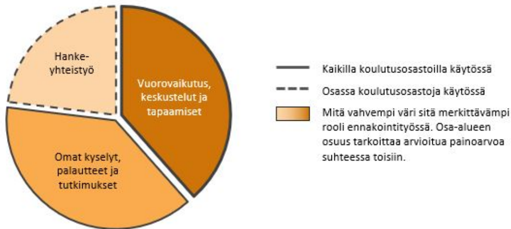
KUVIO 2. Sidosryhmäyhteistyössä vahvimpana näkyvät vuorovaikutus, keskustelut ja tapaamiset. Lisäksi hyödynnetään kyselyjä, palautteita ja tutkimuksia. Hankeyhteistyö kautta saadaan näkymiä tulevaisuuden osaamistarpeisiin

Toinen selkeästi haastatteluissa esille noussut asia oli sidosryhmäyhteistyön hyödyntäminen ennakoinnissa (kuvio 2). Sidosryhmäyhteistyössä vahvasti näkyvillä ovat erityisesti vuorovaikutus, keskustelut ja tapaamiset yhteistyökumppaneiden kanssa. Kiinteä yhteistyö ja vapaa vuorovaikutus koetaan erityisen hedelmälliseksi: näin saadaan säännöllisesti tietoa siitä, millaista osaamista työelämässä tarvitaan. Tämä osa-alue nousi voimakkaasti esiin Oamkin kaikilla koulutusosastoilla.