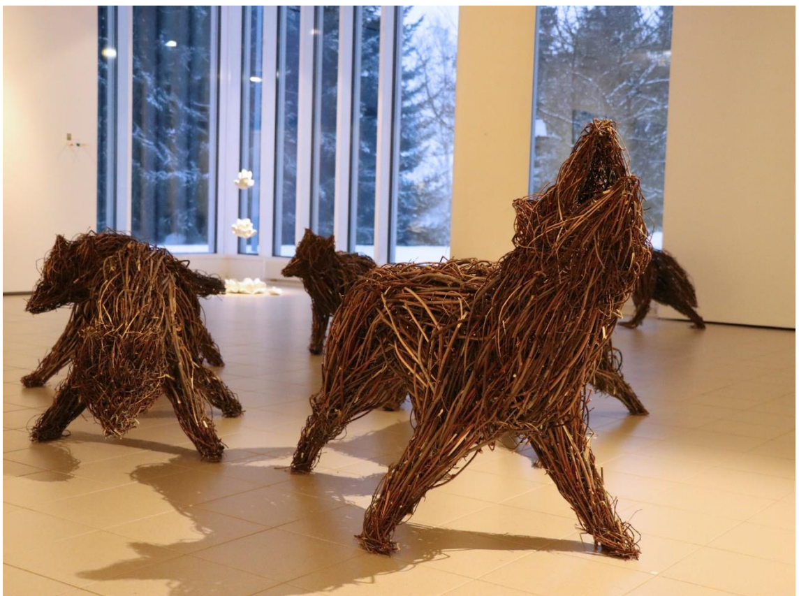
Kuva 9. Johtajasusi (Ahvenainen 2020)