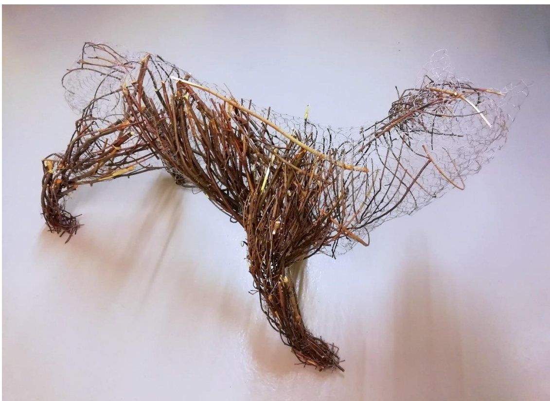
Kuva 5. Risuja rungossa (Ahvenainen 2020)

Kolmannen suden kohdalla aloin ymmärtää enemmän muodon päälle, ja miten se kannatti rakentaa. Ymmärsin paremmin, miten jokainen oksa pitäisi sijoittaa kehikkoon, jotta susi pysyisi kasassa ja muoto hahmottuisi. Päätin, että rakennan sudet niin, että ne ovat hyvin päällystetty risuilla, ja lopuksi lisäisin vielä tarkemmin yksityiskohdat ja kultaiset risut jokaiseen (Kuva 6). Loppua kohden parantelin susien jalkoja ja tuin ne rautalangalla niin, että ne eivät lyyhistyisi maahan. Kävin myös välillä tarkastelemassa susien muotoa ja kokonaisuutta ulkona, jotta osaisin katsoa selkeämmin, mitä suden ulkomuoto vielä tarvitsi (Kuva 7).