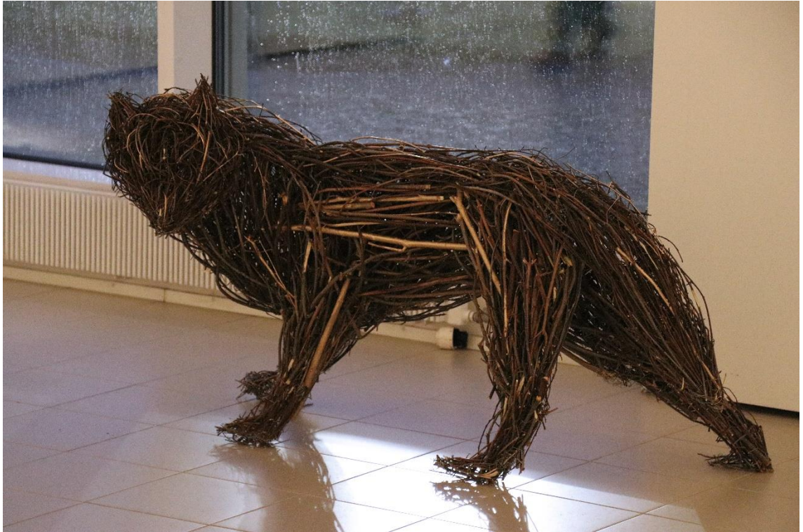
Kuva 10. Yksinäinen susi, Laiho (Ahvenainen 2020)