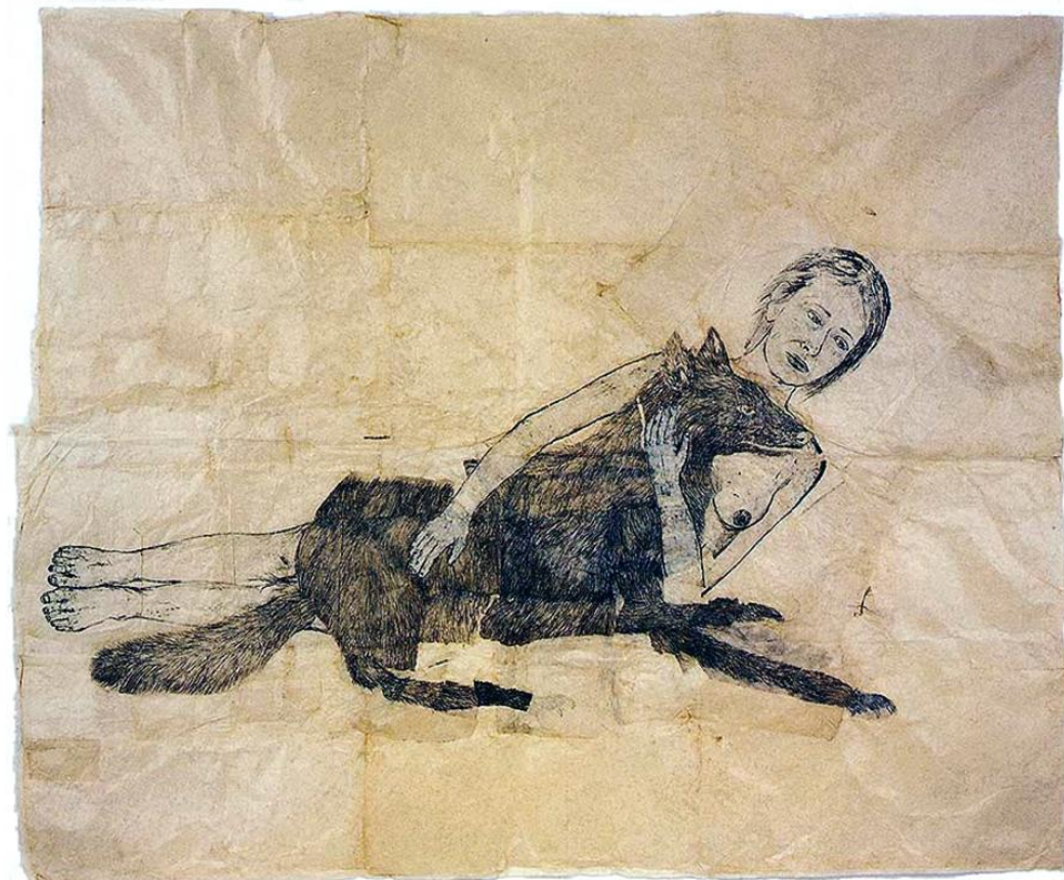
Kuva 2. Kiki Smith, Lying with the wolf , 2001, 88 cm x 73 cm (Khan Academy. https://www.khanacademy.org/humanities/ap-art-history/global-contemporary/a/kiki-smith-lying-with-the-wolf )