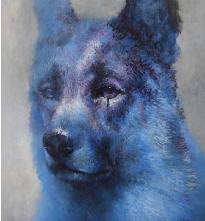
Kuva 1. Samuli Heimonen, Nukka/Tuft, 2016, 120 cm x 110 cm (Samuli Heimonen. https://www.samuliheimonen.com/teokset/2016/59/ )

Nykyään suden arvon näkee taiteessa enemmänkin ihailtavana. Monet nuoret taiteilijat rakastavat piirtää ja maalata susia. Internetin maailmasta löytää paljon taiteilijoita, jotka kuvittavat susista monenlaisia kuvia, osa piirtää, maalaa digitaalisesti ja perinteisesti taiteilijat luovat myös veistoksia. Olen huomannut, että ulkomailla sutta piirretään paljon enemmän kuin Suomessa, mutta yksi tunnettu suomalainen susitaiteilija on Samuli Heimonen. Heimosen susimaalaukset ovat luonteeltaan lempeitä ja empaattisen oloisia, aivan kuin susi olisi teoksessa läsnä, kuten kuvassa 1 näkyy suden kauneus.