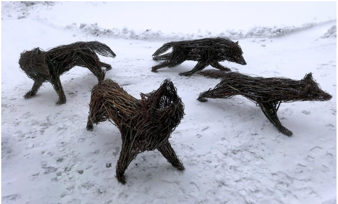
Kuva 7. Susien tutkintaa (Ahvenainen 2020)