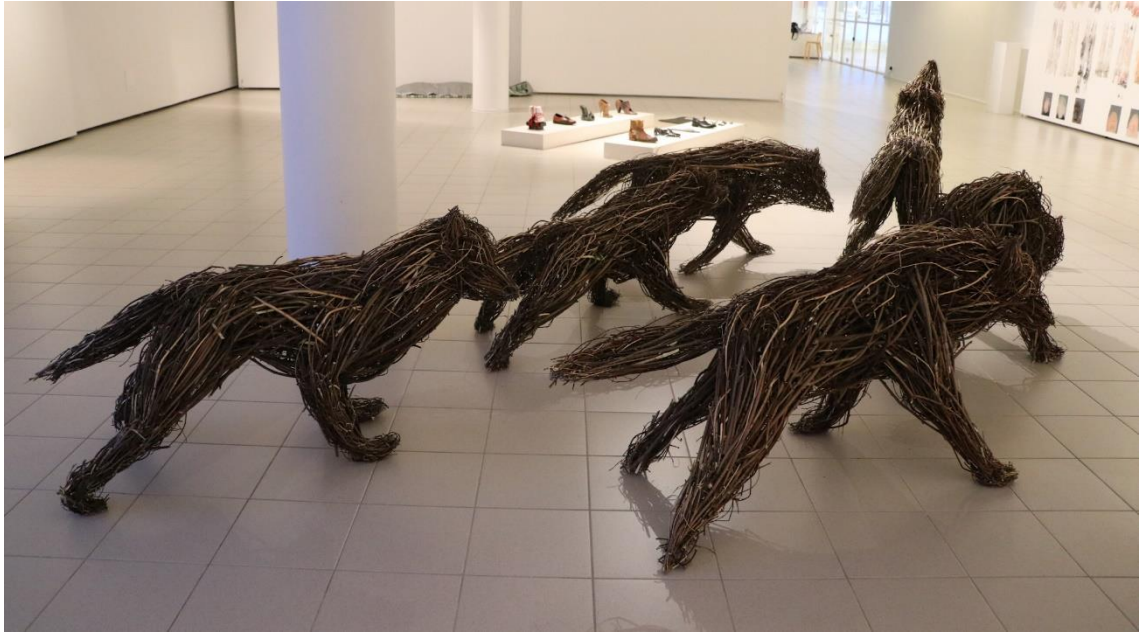
Kuva 8. Lauma etenee (Ahvenainen 2020)