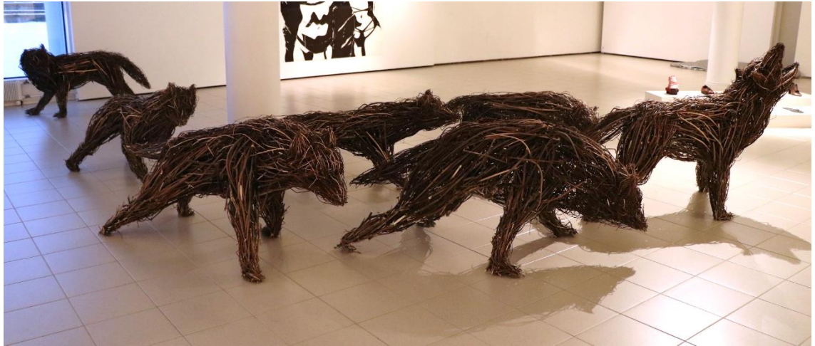
Kuva 11. Koko lauma, Yksin ja yhdessä olemme vahvoja (Ahvenainen 2020)

Opinnäytetyötä tehdessäni ymmärsin enemmän, miten ajankohtainen tämä suden arvon käsittely nykyään on. Sudesta puhutaan paljon erilaisissa haastatte- luissa, tutkijat kertovat väitöskirjoissaan omia näkemyksiään ja susista kirjoite- taan enemmän tietokirjoja. Omasta mielestä on hienoa, että tein tämän susiteok- sen lopputyökseni, koska ajankohtaisuus sopi hyvin mukaan.