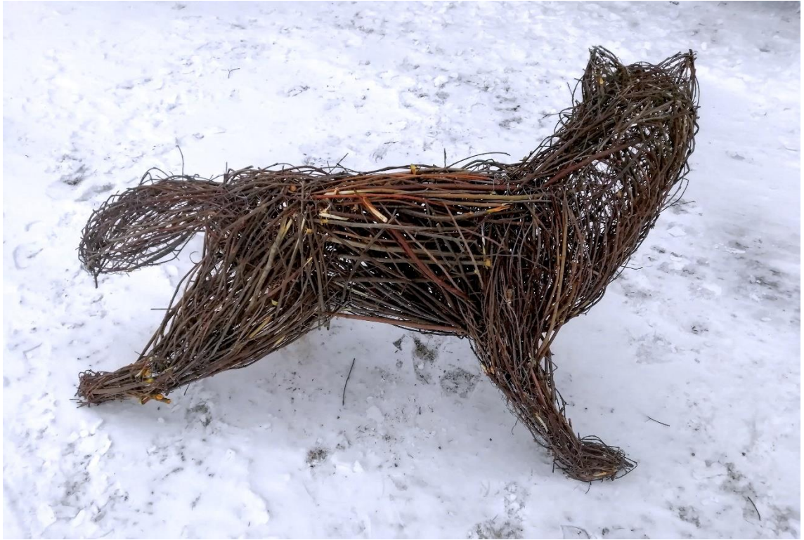
Kuva 6. Runko täytetty oksilla (Ahvenainen 2020)