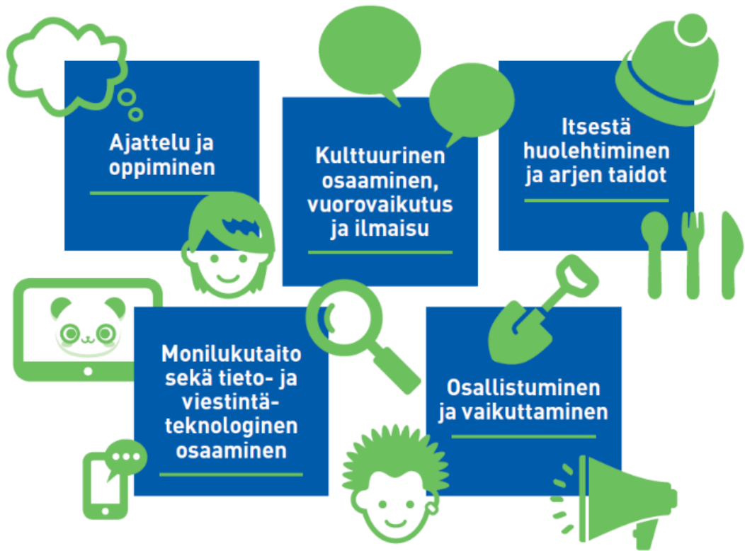
Kuvio 3: Laaja-alaisen osaamisen osa-alueet. (Opetushallitus 2019.)

Laaja-alaisen osaamisen viidestä osa-alueesta opinnäytetyöni aihe liittyy keskeisimmin lasten vuorovaikutuksellisten ja itseilmaisullisten taitojen kehittymiseen sekä kulttuuriseen osaamiseen. Kunnioittava suhtautuminen muihin ihmisiin sekä vuorovaikutustaidot erilaisissa tilanteissa ja ympäristöissä ovat lapselle tärkeää pääomaa nyt ja tulevaisuudessa. Näitä taitoja opitaan parhaiten tarjoamalla lapselle vaihtelevia oppimisympäristöjä ja -tapoja, erilaisia kohtaamisia sekä säännöllistä kanssakäymistä myös muiden kuin lapsen omien vertaisryhmien kanssa.