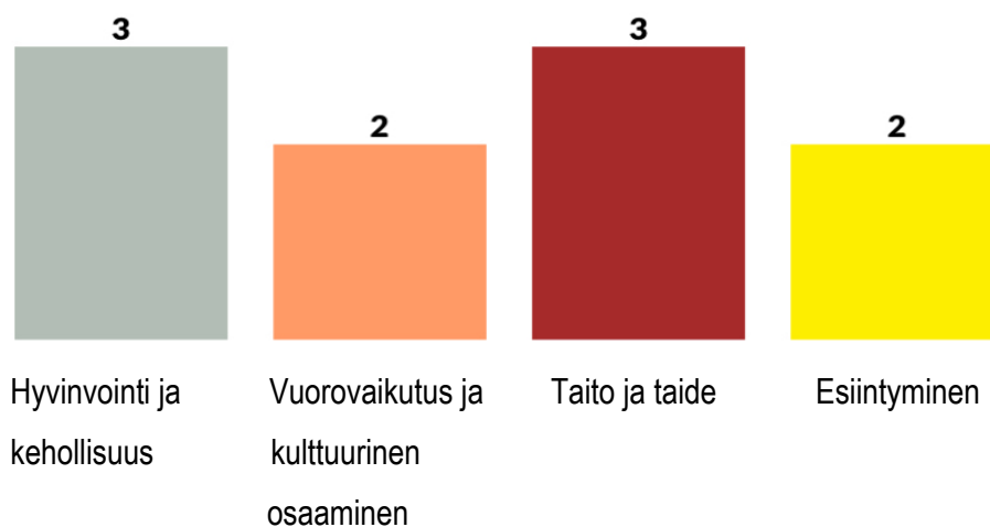
KUVIO 2. Osaaminen taiteellisen projektin alussa