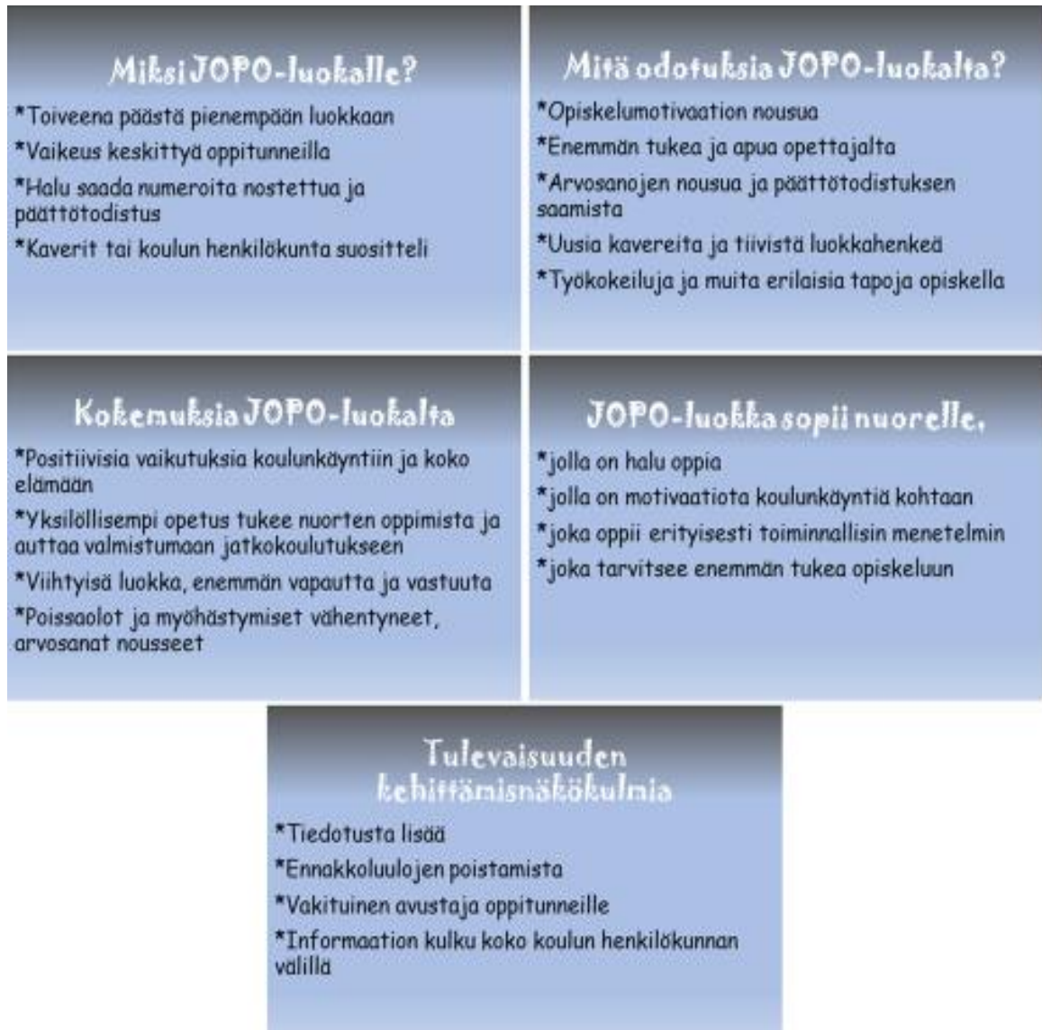
Kuvio 1. Tulokset haastatteluista.

Kuvio 1 esittää haastattelutuloksia tiivistettynä. Kategorioimme tulokset viiteen eri alueeseen. Näihin keräsimme ne vastaukset, jotka toistuivat ja nousivat selkeimmin pinnalle haastateltujen kertomista asioista. On hienoa nähdä, että syyt hakeutua joustavaan perusopetukseen sekä odotukset JOPO-luokasta ovat nuorilla toteutuneet. Se näkyy hyvin heidän kokemuksistaan JOPO-luokalla. Tämä kertoo siitä, että joustava perusopetus on vastannut hyvin opiskelijoiden toiveisiin.