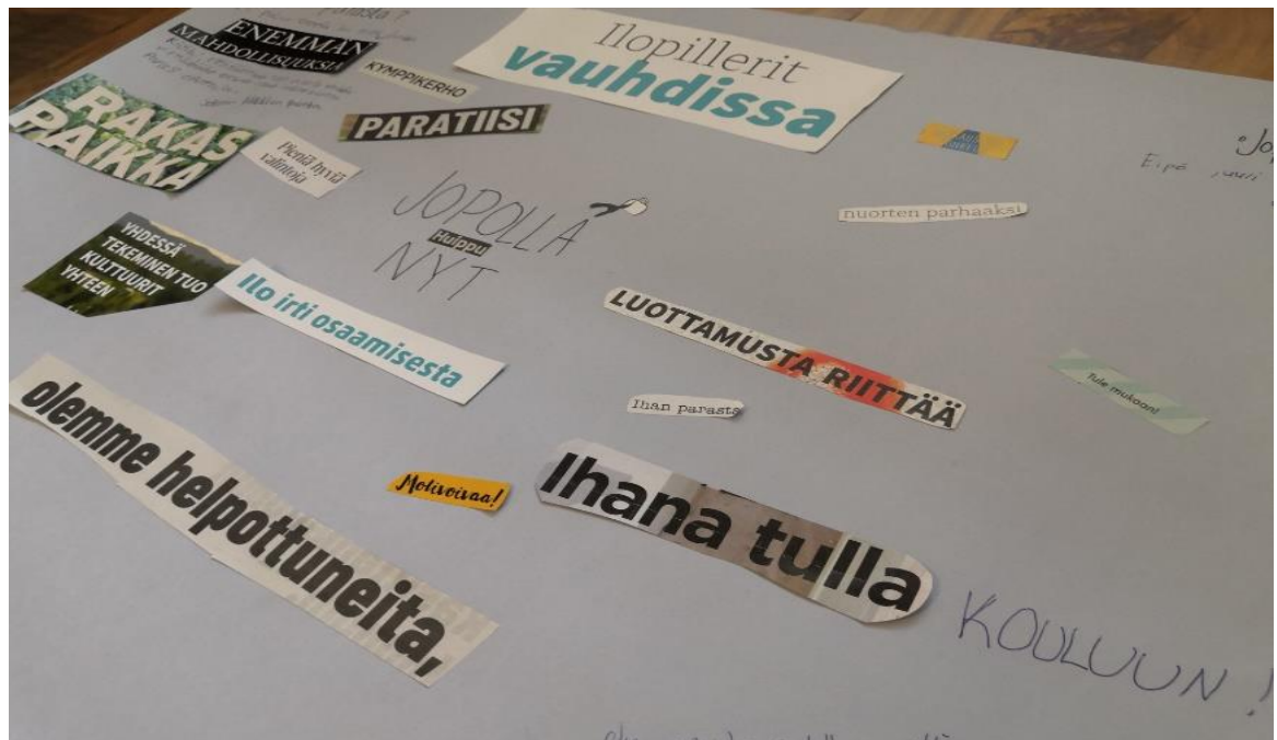
Kuva 1. Posteri. (JOPO-luokka 2019).