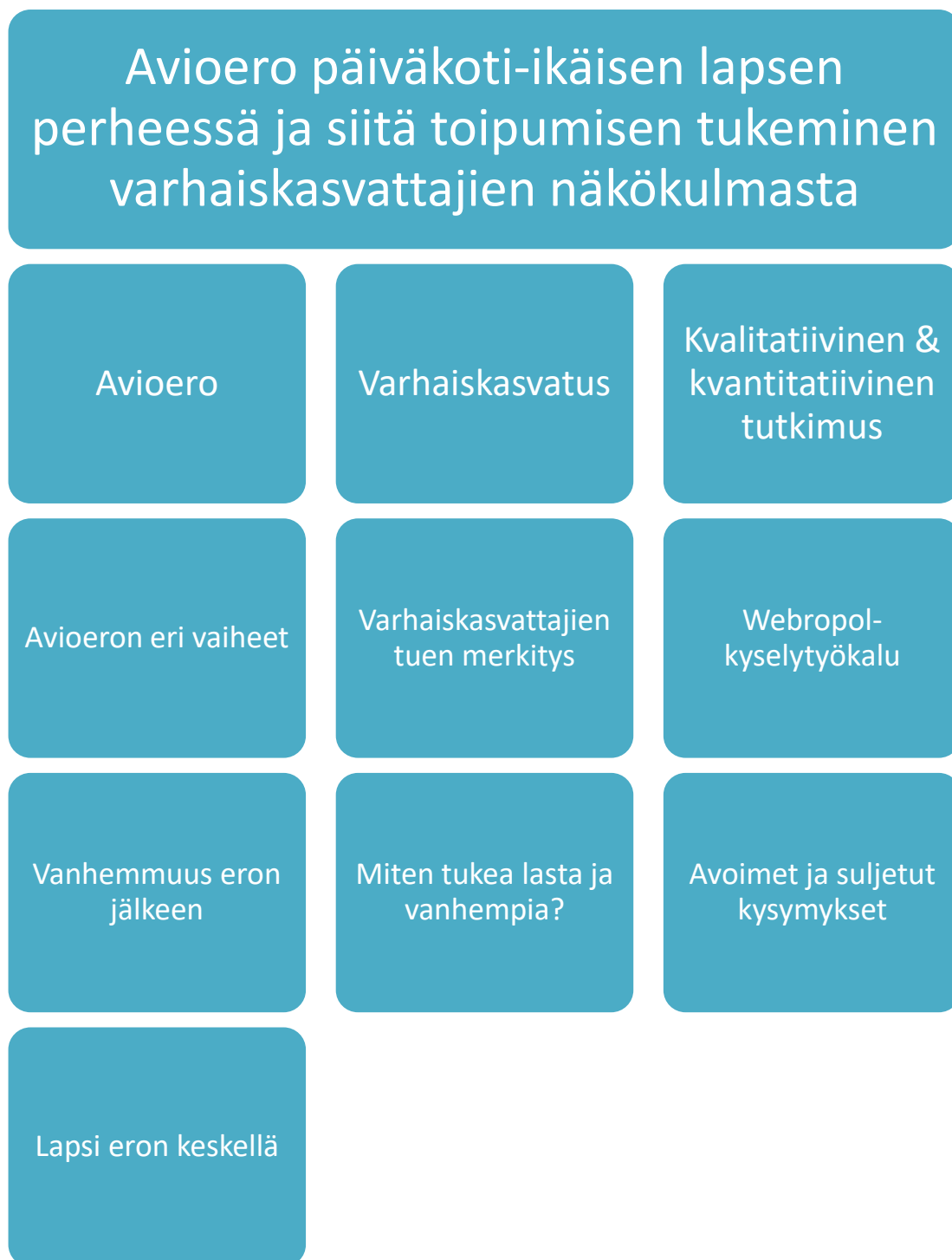
Kuvio 1. Lapsen ja perheen tukeminen varhaiskasvattajien näkökulmasta.