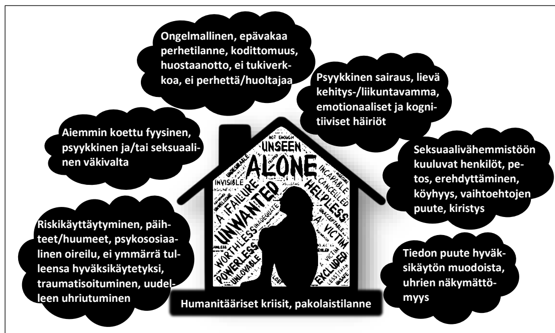
Kuvio 3. Ihmiskaupalle altistavia riski- ja haavoittuvuustekijöitä (Zimmerman, Hossain, Yun, Roche, Morison ja Watts 2006, 8-21; Thompson, Haley 2018, 301)