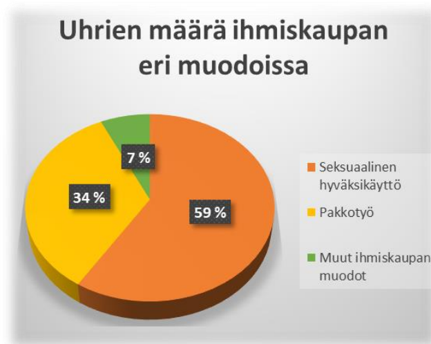
Kuvio 1. Uhrien määrät ihmiskaupan eri muodoissa v. 2016 (UNODC 2018, 9)