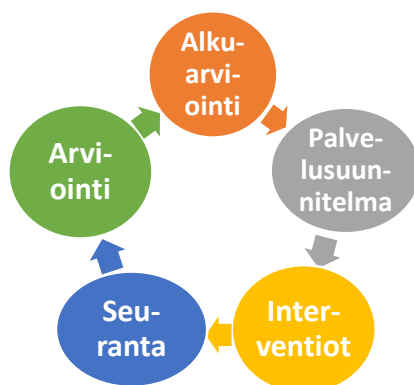
Kuvio 5. Moxleyn monitoiminnallisen case managementin malli

Asiakkaan ympärille muodostuvaa palvelujen kokonaisvaltaisuutta, koordinoitua, osaamisen eri alueita, erityispiirteitä ja haasteita on käsitelty Moxleyn monitoiminnallisen case managementin mallin pohjalta kuntoutusprosessia kuvatessa (kuvio 5).