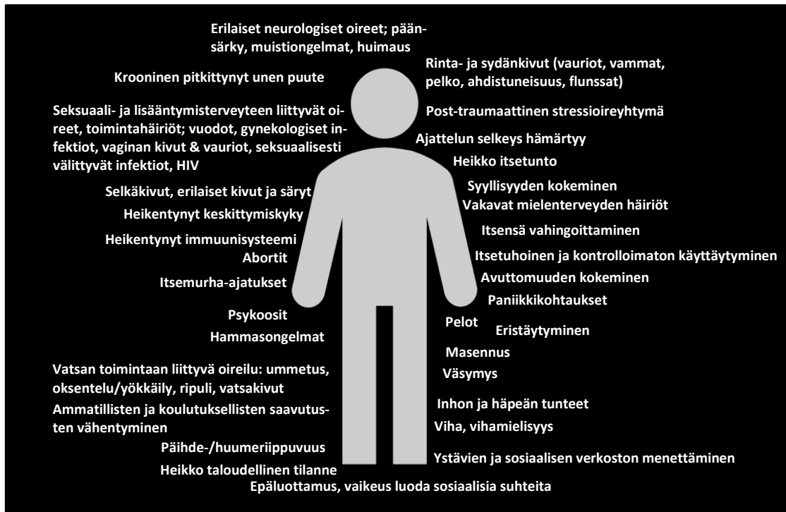
Kuvio 4. Seksuaalisen hyväksikäytön seurauksia (Zimmerman ja muut, 2006, 8-21; Roselli ja muut 2018, 14, 33; Handbook on counselling asylum seeking and refugee women victims of gender-based violence 2019, 24)

UNODC:n raportin (2018, 13) mukaan seksuaaliseen hyväksikäyttöön liittyvässä ihmiskaupassa käytetään usein fyysistä väkivaltaa ja pakkokeinoja. Uhreja "metsästetään" kuitenkin myös petoksella ja hyväksikäyttämällä heidän haavoittuvaa asemaansa. Pelko, luottamuksen puute ja syvä häpeä estävät usein uhreja puhumasta. Jotta uhrien fyysisiin, psyykkisiin, sosiaalisiin ja taloudellisiin tarpeisiin kyettäisiin vastaamaan, on ihmiskaupan uhrien kanssa tekemisissä olevien eri toimijoiden kyettävä tunnistamaan ihmiskauppaan liittyvä erilainen ja usein kompleksinen konteksti ja se todellisuus, joissa seksuaalinen hyväksikäyttö tapahtuu. Erityisenä huolen aiheena on lasten ja erityisesti tyttöjen kauppaaminen. (UNODC 2018, 13.) Ritual abuse pages:n (n.d.) mukaan amerikkalainen psykohistorioitsija deMause (The Journal of Psychohistory 1998) sanoo lapsuuden historian olleen painajaisista, josta olemme vasta alkaneet herätä. Mitä pidemmälle historiassa mennään, sitä järkälemäisimpinä näyttäytyvät heitteillejätto, laiminlyönti, välinpitämättömyys ja julmuus. Mitä todennäköisemmin lapsia on tapettu, hylätty, lyöty, terrorisoitu ja hyväksikäytetty huoltajiensa taholta. deMause (1998) toteaa elämänmittaisen lapsuuden ja yhteiskuntaan liittyvän psykohistoriallisen tutkimuksensa johtopäätöksenä jopa niinkin rajusti, että ihmiskunnan historia perustuu lasten hyväksikäyttöön. (Ritual abuse pages n.d.)