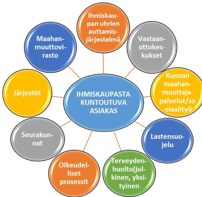
Kuvio 6. Asiakkaan ympärille rakentuvaa moniammatillista verkostoa

Kotikunnan sosiaalityön piirissä olevan asiakkaan palvelua koordinoi yleensä sosiaalityöntekijä, jonka myös eräessä haastattelussa katsottiin olevan vastuussa yhteyksien ylläpitäjänä. Asiakascasen aikana pidetään asiakkaan suostumuksella verkostotapaamisia ja kartoitetaan mitä kukakin tekee ja missä vaiheessa asiakkaan tilanteessa ollaan. Aineistosta nousevien käsitysten mukaan verkostotyössä on omat haasteensa, sillä aina kaikkien ammattilaisten näkemys ei kohtaa siinä mikä olisi asiakkaan paras ja eri ammattilaistahot lähestyvät asiaa eri näkökulmista. Yhteistyö vaatii avointa dialogia. Haasteista huolimatta verkostotyöstä todettiin olevan hyviä kokemuksia. Monialaista, eri ammattitahojä yhteen tuovaa dialogia pidettiin tärkeänä, sillä eri alojen ammattilaiset näkevät asiakkaiden tilanteet eri näkökulmista ja kohtaamisissa asiakkaan kanssa jollain taholla syntyy sellaista keskustelua mitä ei syntyisi jonkin toisen tahon ollessa kyseessä. Saman asian sisällä on monia toimijoita, jotka pystyvät eri tavoin näkemään ja ymmärtämään asiakasta ja tämän tilannetta. Erilaisten ryhmien välinen keskustelu ja kanssakäyminen lisää kaikkien toimijoiden kokonaisymmärrystä, tukee ammatillista toimijuutta ja ammattiosaamisen ylläpitämistä.