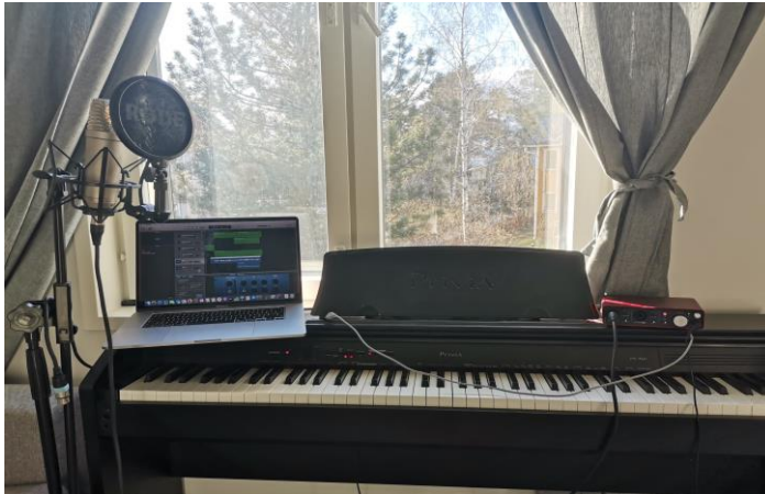
Kuvio 4. Iidan kotistudio

Halusimme jakaa osana opinnäytetyötä äänitteet jokaiseen kappaleeseen, jotta konsertin sisältö konkretisoituisi myös lukijalle. Teimme itse sovitukset, vaikka saimmekin hie- man apua erilaisissa yksityiskohdissa, kuten miksaamisessa. Äänitimme kappaleet ko- tona omilla äänitysvälineillä. Äänitysohjelmana käytimme GarageBandia, jonka omak- suimme vaivattomasti. Ohjelma on todella selkeä ja helppokäyttöinen, joka nopeutti työ- kentelyämme. Jaoimme valmiit kappaleet äänitiedostojen suoratoistopalveluun nimeltä Soundcloud.