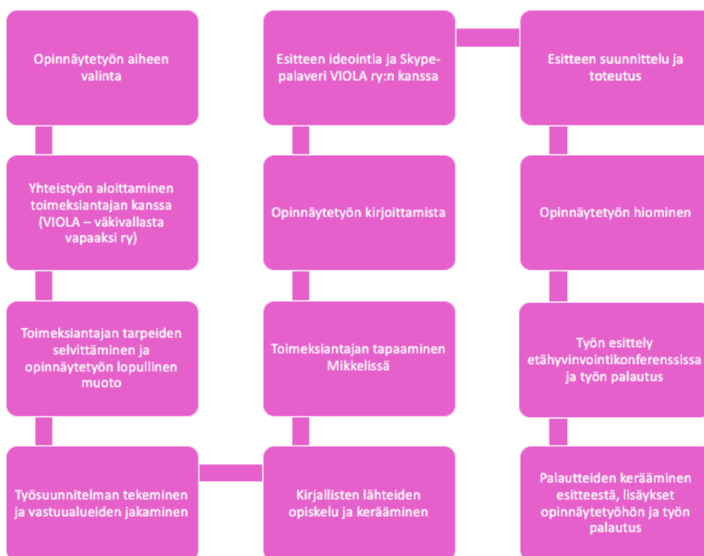
KUVIO 1. Prosessikaavio opinnäytetyön etenemisestä.

Työskentely aloitetaan aina yksilötyöskentelyllä kokija edellä. Näin saadaan tuettua hänen voimaantumistaan. Asiakkuudessa on paljon pareja. Tekijöistä noin puolet hakeutuu itsenäisesti VIOLA ry:n palveluihin ja noin puolet tulee ohjauksena poliisilta, lastensuojelusta tai päihdehuollosta. Tekijätyössä keskitytään siihen, mitkä tekijät ovat väkivallan taustalla sekä etsitään keinoja muutoksen toteuttamiseksi. VIOLA ry:n työntekijöiden mukaan on tärkeää panostaa asiakkuuden alkuun, jotta asiakkaalle jää sellainen olo, että työskentelyä kannattaa jatkaa. Asiakkaat kantavat usein häpeää ja syyllisyyttä väkivaltaisuudestaan, mikä ei ole ainoastaan huono asia vaan häpeä voi toimia myös motiivina muutostyölle. VIOLA ry:n asiakkaista noin 20% on tekijöitä, mikä tarkoittaa vuositasolla 80-90 tekijäasiakasta. Tekijätyö ei ole pitkäkestoista. (Haapiainen ym. 2020-01-17.)