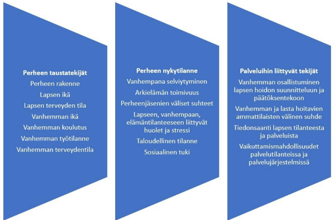
Kuvio 2. Osallisuuteen vaikuttavia taustatekijöitä Vuorenmaan mallia mukaillen (Lähde: Vuorenmaa 2016, 37).

nen kokemus omasta vanhemmuudesta ja pärjäämisestä puolestaan lisää osallisuuden kokemusta. Toimiva perhearki, hyvä tukiverkosto sekä hyvä parisuhde ovat yhteydessä vahvaan osallisuuteen. (Vuorenmaa 2016, 33.)