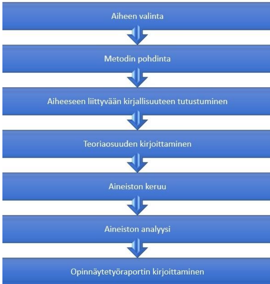
Kuvio 5. Opinnäytetyöprosessi

Teimme toimeksiantajan kanssa toimeksiantosopimuksen sekä haimme asiaankuuluvat tutkimusluvut. Etsimme aiheesta kirjallisuutta ja muita tutkimuksia. Läheteitä pyrimme hyödyntämään monipuolisesti. Huomioimme muiden tutkijoiden työt asiaan kuuluvasti ja viittaamme julkaisuihin niihin kuuluvalla tavalla. (Tutkimuseettinen neuvottelukunta 2018.) Koko tutkimusprosessin ajan huomioimme eettisyyden periaatteen pyrkien välttämään plagioinnin (Pohjola 2007, 13–17).