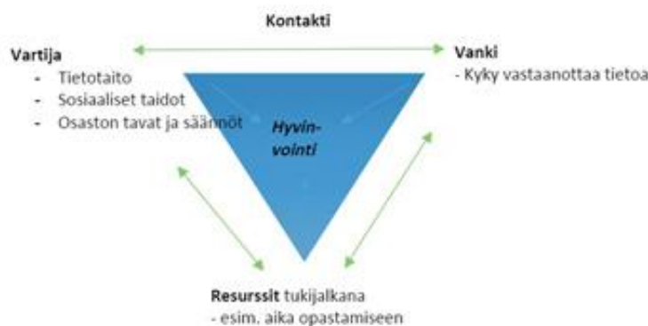
Kuvio 2: Hahmotelma vangin perehdytykseen vaikuttavista tekijöistä (Ylisassi ym. 2016, 54.)

Alla oleva hahmotelma (kuvio 2) osoittaa, että perehdytyksen onnistuminen vaatii vartijalta sosiaalisia taitoja sekä tietotaitoa. Lisäksi siihen vaikuttaa vankiosaston säännöt ja toimintatavat. Keskeinen osa perehdytyksen onnistumista on myös riittävät resurssit eli aika. Perehdyttäminen ei kuitenkaan onnistu, ellei vanki ole kykeneväinen vastaanottamaan hänelle tarjottua tietoa. (Ylisassi ym. 2016, 54.)