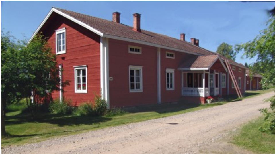
Kuva 1. Säätyläiskotimuseo