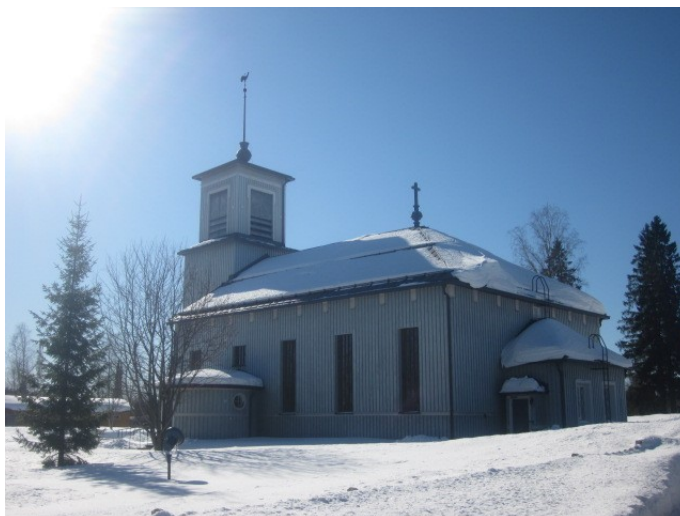
Kuva 3. Pylkönmäen kirkko

Pylkönmäen kirkonkylän yleiskaava kuvaa muun muassa strategisia tavoitteita, uhkakuvia, mahdollisuuksia ja vahvuuksia, kulttuuriympäristöä sekä matkailun kehittämistä. Uhkakuvina pidetään väkiluvun pientymistä ja vahvuuksina sekä mahdollisuuksina muun muassa luonto- ja metsästysmatkailun mahdollisuuksia, musiikkikulttuuria, kulttuurihistoriallisia kohteita, harrastusmahdollisuuksia ja matkailun kehittämistä. Kirkonkylällä on arvokkaita rakennettuja kulttuuriympäristöjä, mutta ei kuitenkaan arkeologista kulttuuriperintöä. Yleiskaavassa aiotaan vaalia kulttuuriympäristön piirteitä muun muassa maankäyttöratkaisuilla ja kaavamerkinnöillä. (Pylkönmäen kirkonkylän yleiskaava, 2012.)