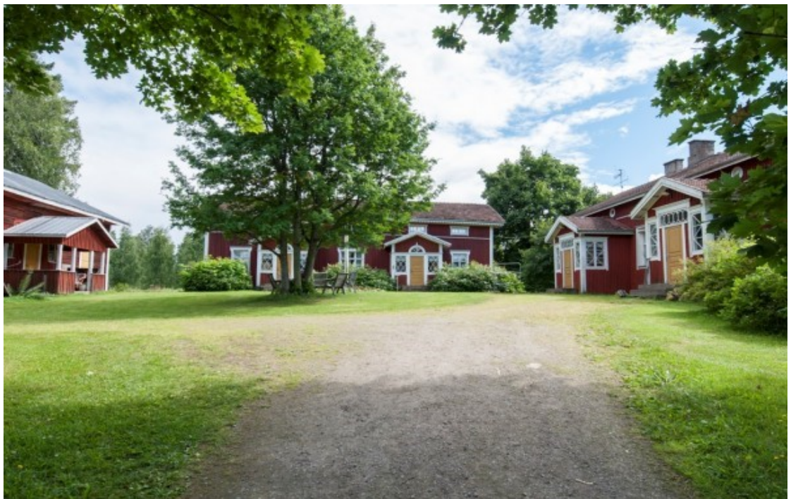
Kuva 2. Lauttamäen perinnetila

Saarijärven kaupungin keskusta on upealla paikalla ja on rakentunut kolmen järven Saarijärven, Herajärven ja Lumperoisen keskiöön. Saarijärvellä on tarjolla runsaasti kulttuurikohteita, luontokohteita, majoitusta, ruokaa ja tapahtumia. Majoitusta tarjoavat useat laadukkaat hotellit, mökit, aamiaismajoitukset, huoneistot ja maatilamajoituspaikat, joissa voi järjestää myös juhlia. (Visit Saarijärvi ja ympäristö, 2017.) Hyvänä esimerkkinä on Lauttamäen tila Pylkönmäellä (Kuva 2), joka järjestää juhlia hääpareille ja yrityksille kesäisin. Tilan miljöö on upea ja kulttuurihistoriallisesti arvokas, sillä ensimmäiset rakennukset ovat valmistuneet 1860-luvulla ja tilalla on ollut aikoinaan ollut yli 40 rakennusta, joista osa on palanut vuosien varrella. Nykyään tilalla sijaitsee noin 20 rakennusta, muun muassa aittoja, matkailurakennus ja pihasauna. Lauttamäki on saanut myös valtakunnallista ja maakunnallista tunnustusta maaseudun perinteiden sekä kulttuuriympäristön vaalimisesta. (Lauttamäen perinnetila, 2018.)