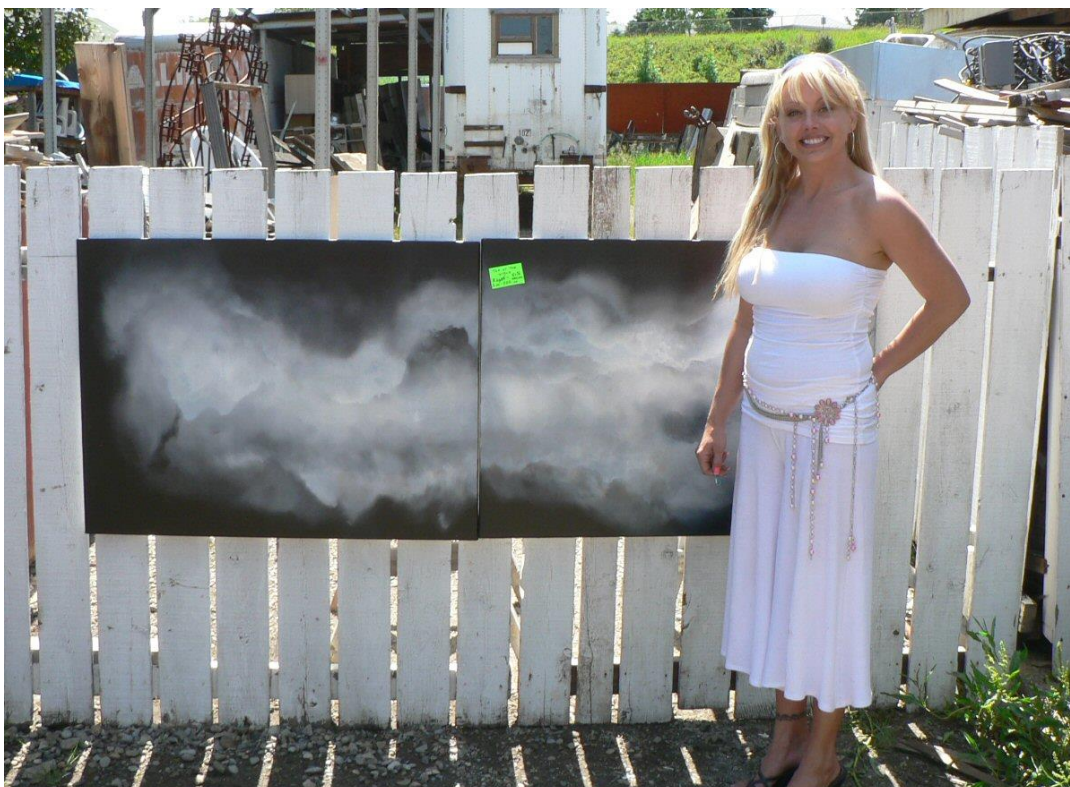
(Kuva 2. James Tworow, "An Artist's Studio" 2006)

Kuvan lavastukseen panostaminen voi olla yllättävän tehokas keino suojata netissä olevat teoskuvat varkauksilta: valokuva taulunsa kanssa poseeraavasta taiteilijasta ei ole yhtä riskialtis kuvavarkauksille, kuin esimerkiksi pelkkä skannattu versio teoksesta. Poseeraaminen taulun kanssa on myös hyvä tapa esittää katsojalle taulun todellisen koon.