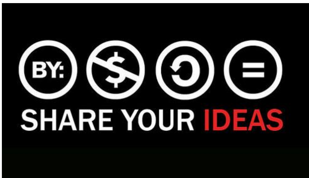
Kuva 1. Nassim Tiachachat, ”Share your ideas” 2014

CC-lisenssin hyviä puolia ovat sen yksinkertaisuus ja ymmärrettävyys sekä se, että lisenssejä voi yhdistellä keskenään, tehden siitä juuri teokseen ja sen käyttötarkoitukseen sopivan. CC-lisenssejä käytetään pääasiallisesti internetissä olevien teosten kanssa, mutta niiden käyttö on levinnyt myös netin ulkopuolelle.