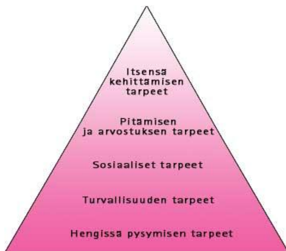
Kuvio 1: Tarvehierarkia (Kuluttajavirasto 2011).

asenteiden, kulttuurin, havaintojen sekä matkan määrän mukaan. Matkailijan tarpeita ja matkustusmotiveja tarkastellaan Maslow'n tarvehierarkia mallin avulla (Kuvio 1). Mallin mukaan ihminen pystyy nousemaan pyramidilla ylöspäin tyydyttäessään ensiksi fysiologiset tarpeensa ja nousta yhä ylemmäs henkisemmälle tasolle huippua kohti. (Vuoristo 2002, 38 - 42.)