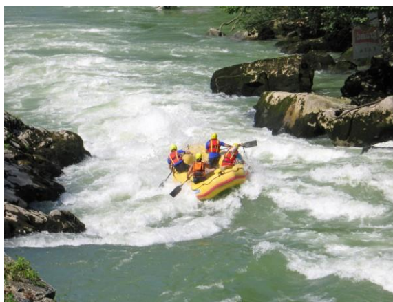
Kuva 8: Koskenlaskua Bosnia ja Hertsegovinassa (World Culture Tourism 2011).

la pienellä kaistaleella Adrianmeren rannalla sijaitseva alle 5000 asukkaan kaupunki Neum on oikeastaan ainoa rantalomakohde. Sen sijaan luonto, kulttuuri, arkkitehtuuri ja historia ovat vertaansa vailla ja Bosnia ja Hertsegovinassa on monia kohteita, joita ei pidä jättää näkemättä. Monikulttuurisuuden ja historian tapahtumat pystyy kokemaan yhdessä kauniiden maisemien kanssa, sillä kaikki kaupungit ovat vielä pieniä ja luonnonläheisiä. Maan vuoristot ja vesistöt tarjoavat paljon mahdollisuuksia monipuoliselle teemamatkailulle, sillä eri aktiviteetteja on runsaasti, esimerkkeinä melonta, koskenlasku (Kuva 8), patikointi (Kuva 9), maastopyöräily, vuorikiipeily, laskettelu ja hiihto. (Clancy 2010, 84 - 87.)