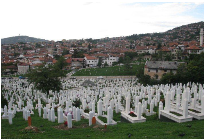
Kuva 4: Sodassa menehtyneiden hautakiviä Sarajevossa (Teliö 2010).

Amerikkalaisella diplomatiolla syntyneellä Daytonin rauhansopimuksella Bosnia jaettiin lähes tasan kahteen osaan: serbitasavalta Republika Sprska:an sekä bosniakkien ja kroaattien liittovaltioon Federacija Bosna i Hercegovina:an. Näin saatiin päätökseen sota, joka vaati arviolta 200 000 hengen ja samalla loi uuden Bosnia ja Hertsegovinan valtion perustuslain. Pitkään piiritetystä pääkaupungista Sarajevosta tuli uuden valtion monikansallisten sotilaallisten voimien turvaama hallinnon keskuspaikka. Kansainvälinen sovittelija laajoine toimivaltoineen määrättiin valvomaan poliittista prosessia. Amerikassa syntynyt sopimus sai nimekseen Daytonin rauhansopimus samannimisen kaupungin mukaan, jossa pääosa sopimuksen neuvotteluista käytiin. (Torsti 2007, 38 - 39; World Travel Guide 2010.)