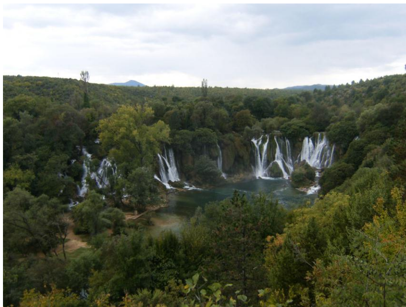
Kuva 6: Kravican vesiputoukset (Teliö 2010).

osista Hertsegovinaan saakka levittyvät maailman suurimmat karstimaakentät syvine kalkkikiviluolineen ja mutkittelevine pohjavesijärjestelmineen. Koko Bosnia ja Hertsegovinan alue on täynnä juomakelpoista vettä tarjoavia lähteitä ja vesistöjen runsaus onkin Euroopan kärki-luokkaa. (Clancy 2007, 6 - 7; Encyclopedia of Nations 2010.)