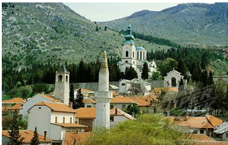
Kuva 7: Uskonnot kohtaavat Mostarissa: moskeija ja kirkko (Landscape Art 2011).

Bosnia ja Hertsegovina on aina ollut tunnettu monikulttuurisuudestaan sodan luomasta väestön jakautumisesta huolimatta. Voidaan jopa sanoa, että Bosnia ja Hertsegovinassa sijaitsee yksi Balkanin alueen rikkaimmista kulttuuriperinnöistä; islam ja ortodoksinen kristillisyys ovat yhdistyneet lännestä tulleiden itävaltaunkarilaisten ja katolisten perinteiden kanssa, minkä voi nähdä kuvasta 7. Usein länsimaalaisia alueella kiehtookin juuri itämainen eksoottisuus keskellä Eurooppaa. (Clancy 2009, 16.)