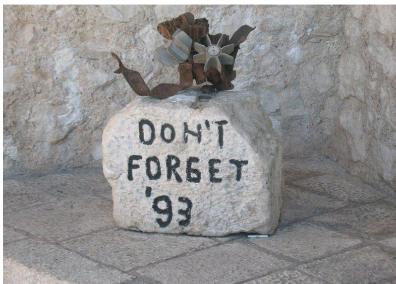
Kuva 5: Don't forget '93 -muistomerkki Mostarissa (Teliö 2010).

säistä kitkaa, mutta toistaiseksi ainakin se on pysynyt yhtenäisenä poliittisena kokonaisuutena. Vuoden 2002 vaaleja voidaan pitää siinä mielessä merkittävinä, että ne olivat ensimmäiset kotimaiset vaalit; aikaisemmat äänestykset olivat kansainvälisen yhteisön hallinnoimat ja valvomat. Sittenkin joitakin todisteita tuli ilmi koskien mahdollista korruptiota kroaattien puheenjohtajakauden jäsenen Covicin toimesta ja hänet irtisanottiin vuonna 2005 ja korvattiin Ivo Miro Jovicilla. (World Travel Guide 2010.)