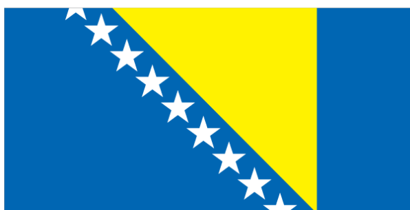
Kuva 3: Bosnia ja Hertsegovinan virallinen lippu (CIA 2011b).

Bosnia ja Hertsegovina jakautuu Daytonin rauhansopimuksen mukaisesti kahteen hallinnolliseen yksikköön eli entiteettiin, Bosnia ja Hertsegovinan liittovaltioon sekä Serbitasavaltaan. Valtion johdossa on kolmihenkinen presidenttineuvosto, joka koostuu kunkin etnisen ryhmän edustajista. Bosnia ja Hertsegovinan valtion lipussa on sinisellä pohjalla keltainen kolmio ja seitsemän valkoista, kokonaista ja kaksi puolikasta tähteä (Kuva 3): kolmio kuvastaa maan muotoa ja sen kulmat kolmea etnistä ryhmää, tähdet Eurooppaa ja värit sininen, keltainen ja valkoinen on usein yhdistetty Bosnia ja Hertsegovinaan ja edustavat rauhaa ja puolueettomuutta. (CIA B&H 2011a; Matkailijan maantieto 2001, 48.)