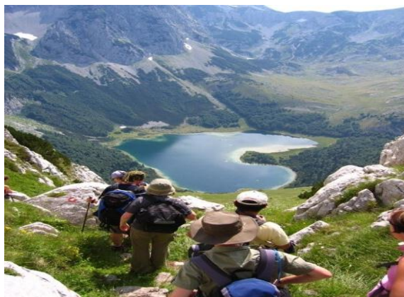
Kuva 9: Patikointia Bosnia ja Hertsegovinassa (World Culture Tourism 2011).

Niin kuin aiemmin jo mainittiin joiltakin alueilta saattaa vielä löytyä sodanaikaisia maa- miinoja, mutta opastetuilla reiteillä ja tunnetuilla matkailualueilla ei niistä ole vaaraa. Parhaat laskettelu- ja hiihtokeskukset löytyvät Jahorina ja Bjelašnica vuorilta (Kuva 10) melko läheltä Sarajevoa. Neljä jokea, Neretva, Vrbas, Una ja Tara, kuuluvat Euroopan parhaimpiin koskenlaskujokiin ja jokien ympärillä olevat koskemattoman luonnon karut maisemat lumoavat kokeneimmankin seikkailijan. Vuoristossa sijaitsevat pienet kylät ovat myös käymisen arvoisia, sillä niissä alkukantaisuus ja perinteet elävät yhä. Kylissä matkaa ajassa taaksepäin ja