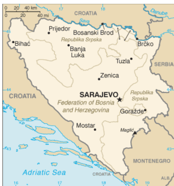
Kuva 2: Tutkimuskohteen kartta (CIA 2011a).