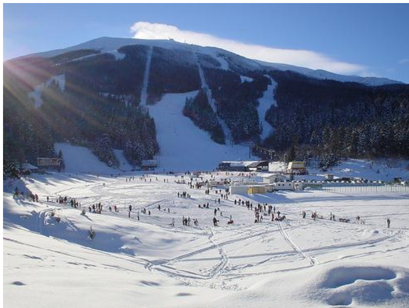
Kuva 10: Talviurheilua Bjelašnica -vuorella (Localyte 2011).

pääsee tutustumaan viljelyyn, käsitöihin ja luomuruokaan lämpimällä vastaanotolla. Kyliin tehdään järjestettyjä käyntejä muutamien matkanjärjestäjien toimesta, mutta omatoiminen hienovarainen vierailu ei yleensä haittaa kyläläisiä. (Clancy 2010, 84 - 88.)