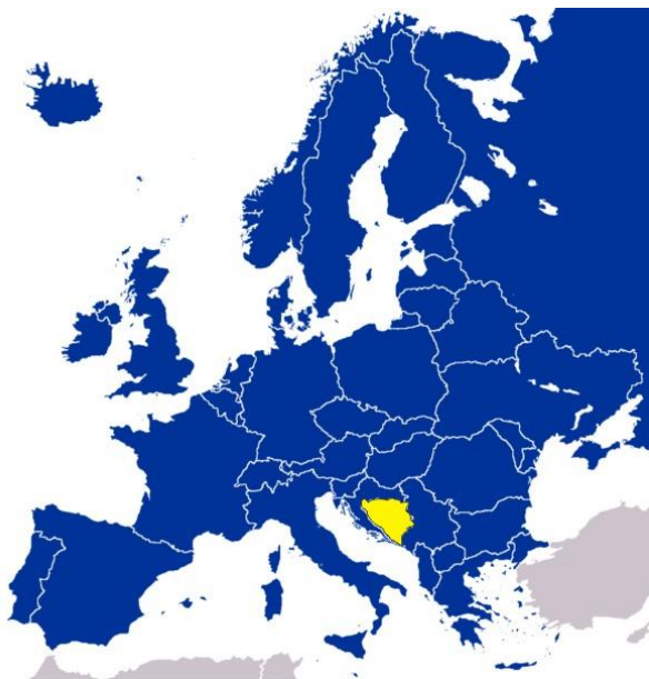
Kuva 1: Tutkimuskohteen sijainti Euroopassa (EMF 2010).

on pieni, n. 20 km:n pituinen kaistale Adrianmeren rannikosta. Maan väestö koostuu bosniakeista, serbeistä ja kroaateista. Pääkaupunki Sarajevo näkyy kuvassa 2 ja se sijaitsee maan keskiosassa, jonka alueelle tihein asutus on keskittynyt. (Matkailijan maantieto 2001, 48; Ulkoasiainministeriö 2006.)