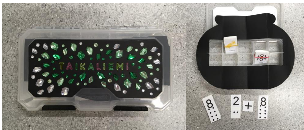
Kuva 2. Taikaliemi-peli

Kehitin tuokiokokonaisuuden mielessäni se, että tarinapohjaa ja tehtäviä voisi hiukan vaikeustasoa muuttamalla käyttää myös pienempien lasten kanssa. Tätä pohtiessani totesin taikaliemitehtävän olevan liian vaikea esiopetusikäisiä nuoremmille, joten aloin