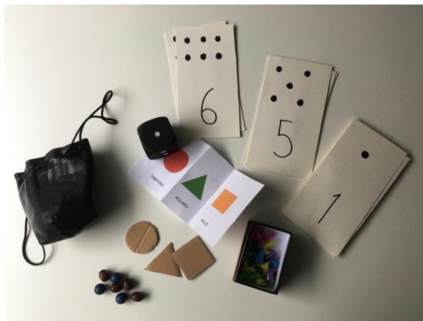
Kuva 1. Velhon matikkapeli: tehtäväkortit, tunnustelupussi, helmet, muovieläimet, geometriset muodot ja noppa.

Tein ensimmäistä tuokiota varten tehtäväkortit, joita oli tarkoitus käyttää ison pehmonopan kanssa (Kuva 1.). Nopan silmäluvun yhdistäminen korttiin, jossa oli vastaava silmäluku ja numeromerkki toisi luontevasti yhden oppimistilanteen lisää korteissa olevien tehtävien lisäksi. Tehtäväkortteihin keksimäni pulmat löytyvät tämän opinnäytetyön liitteenä 1. Osassa tehtävistä käytetään välineenä joko tunnustelupussia, helmiä ja erilaisia pahvista leikattuja muotoja tai rasiaa, jonka sisällä on erivärisiä muovieläimiä. Tuntematta lapsia etukäteen valitsin kortteihin paljon taktiilisia tehtäviä, sillä ne ovat oman kokemukseni mukaan useimmille lapsille mieluisia ja niihin jaksetaan keskittyä, vaikka omaa vuoroa voisi joutua hetken odottamaan. Näihin kuuluivat erilaisten geometristen muotojen ja helmien lukumäärän päättely tunnustelupussia käyttäen. Olin tulostanut geometriset muodot nimineen myös paperille, jotta voisimme kerrata niitä, mikäli ne eivät olisi niin tuttuja lapsille.