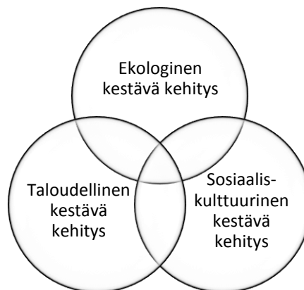
Kuvio 2 Kestävän kehityksen kolme ulottuvuutta

Kirjallisuus puhuu kestävan kehityksen nykyisestä määritelmästä, jossa kestävä kehitys jaetaan kolmeen eri ulottuvuuteen sosiaalis-kulttuuriseen, taloudelliseen ja ekologiseen kestäväan kehitykseen. Kuten alla olevasta kuviosta käy ilmi, kestävan kehityksen ulottuvuudet ovat sidoksissa toisiinsa. Kestävän kehityksen ulottuvuuksia tarkastellaan seuraavissa alaluvuissa tarkemmin. (Cantell 2004, 25–26.)