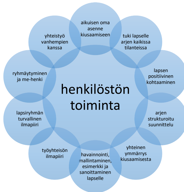
Kuvio 4 Henkilöstön toiminnan keinoja ja menetelmiä, jotka ehkäisevät kiusaamista varhaiskasvatuksessa

Henkilöstön toiminta päiväkodin arjessa on tärkeä tekijä kiusaamisen ennaltaehkäisyssä. Henkilöstön toiminta ja tärkeys tuli esille kaikissa haastatteluissa. Kuvio 4 kuvaa selkeästi kaikki ne kiusaamisen ennaltaehkäisyn osa-alueet, jossa henkilöstöllä on merkittävä rooli. Haastattelut pitivät ennaltaehkäisyn näkökulmasta erittäin tärkeänä, että henkilöstöllä on samansuuntainen käsitys siitä, mitä kiusaaminen on. Eräässä päiväkodissa henkilöstö on keskustellut paljon kiusaamisesta ja kiusaamisen käsitteestä, ja se on toiminut myös päiväkodin toimintakauden yhtenä teemana. Päiväkodeissa on luotu kiusaamisen ehkäisyn ja puuttumisen suunnitelma, yhdessä henkilöstön kanssa. Yhdessä päiväkodissa henkilöstön kesken nähdään tarvetta keskustella vieläkin enemmän siitä, miten kiusaaminen mielletään, ja miten kiusaamistilanteita ratkotaan. Osa henkilökunnasta ei miellä kiusaamista yksilön subjektiivisena kokemuksena, vaan kokevat tilanteiden olevan usein täysin normaalia lasten kinastelua. Eräässä päiväkodissa lähes kaikki tilanteet miellettiin kiusaamiseksi, ja juuri siksi he toivovat, että henkilöstölle muodostuisi yhtenäinen käsitys siitä, mikä on kiusaamista ja mikä ei. Näin lapset eivät oppisi käyttämään kiusaamissanaa tilanteissa, jotka tuntuvat heistä epäreilulta, kuten jos ei oteta leikkiin mukaan tai ei haluta leikkiä hänen sääntöjensä mukaan.