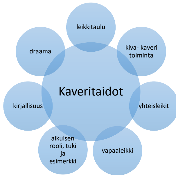
Kuvio 3: Kaveritaitojen harjoittelun menetelmiä päiväkotiryhmien arjessa

Haastatteluissa yhtenä kiusaamista ennaltaehkäisevänä toimenpiteenä on lasten kaveritaitojen kehittäminen. Päiväkodin arjessa kaveritaitoja kehitetään jatkuvasti. Kuvio 3 kuvaa niitä keinoja, joiden avulla lasten kanssa opetellaan kaveritaitoja. Lapset opettelevat päivittäisessä toiminnassa aikuisen tukemana, miten toisille puhutaan ja kuinka toisia kohdellaan. Päiväkodeissa tuodaan lapsen arvokkuutta esiin ja erilaisuudesta tehdään rikkaus. Lapsille opetaan monipuolisesti eri kulttuureita, mikä edesauttaa erilaisuuden hyväksymistä. Kaveritaitojen kehittäminen nähtiin yhden päiväkotiryhmän teemana.