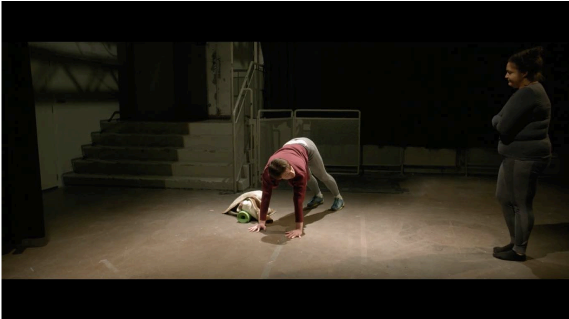
Figure 9: Försoningen.

Jag minns att den här scenen var den mest jobbiga och stressiga att spela in. Scenen spelade vi in sista inspelningsdagen efter fyra väldigt långa dagar med lite sömn. Jag minns att jag i det här skedet var rätt slut fast jag gick på nån slags överenergi. Den här dagen hade vi många scener att filma och jag minns att vi var efter i tidtabellen. Jag tror grunden för min stress var att jag inte själv hade klart för mig vilken version av slutet jag ville ha.