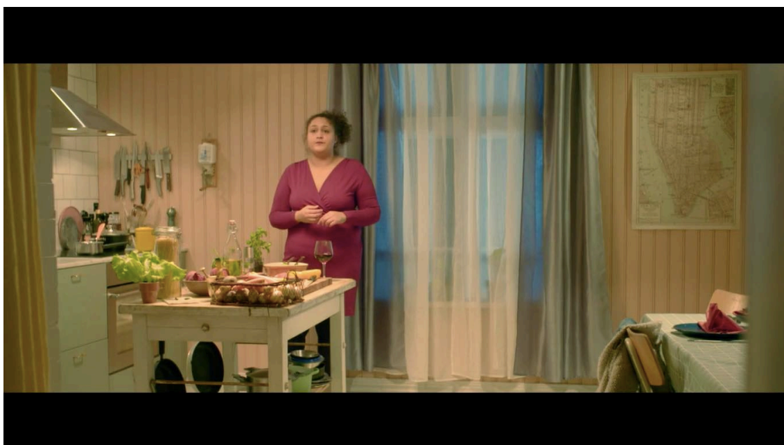
Figure 3: Iris besviken efter att Leo stuckit och spelat sitt nya spel. Anonyma kärleksarbetare, 2019.

Den vida bilden vi filmat fungerade inte helt som vi hoppats och skapade en känsla av distans till karaktärerna och den använde vi egentligen främst för att klippa via och då någon av karaktärerna förflyttade sig. Jag tror att ifall jag tänkte igenom "koreografin" noggrannare och hunnit testa den med skådespelaren och jag tillsammans med fotografen kunnat på förhand gå igenom scenen hade hjälpt oss att tänka om och planera mer fungerande bilder.