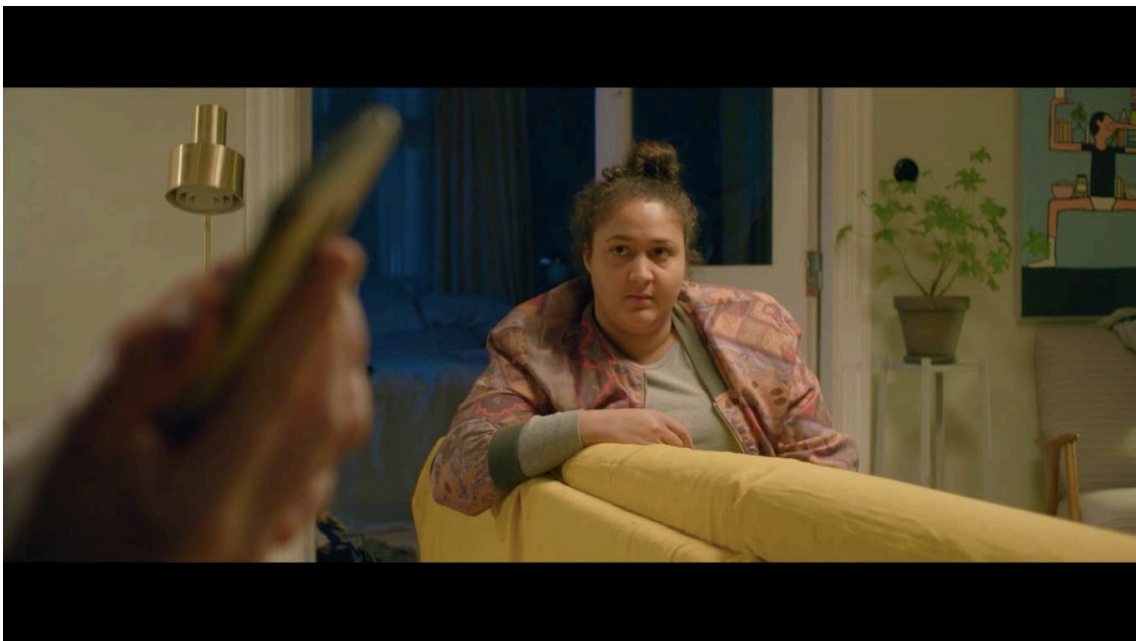
Figure 4:

Jag funderade en hel del på hur jag ville gestalta Iris och Leos uppbrott. Jag ville att det skulle finnas ett allvar och en känsla av att bråket skulle ha en mer realistisk ton än många andra uppskruvade scener. Jag ville att Iris irritation skulle växa och vi för en gångs skull skulle ta ut sin ilska vilket vi inte sett henne göra under filmens gång. Hennes frustration börjar byggas upp redan i stödgruppen i och med att alla hennes förhoppningar om att hennes relation går att rädda och Leo verkligen har förändrats gått i kras. Iris kommer hem och Leo ger henne bara mer orsaker att bli frustrerad över.