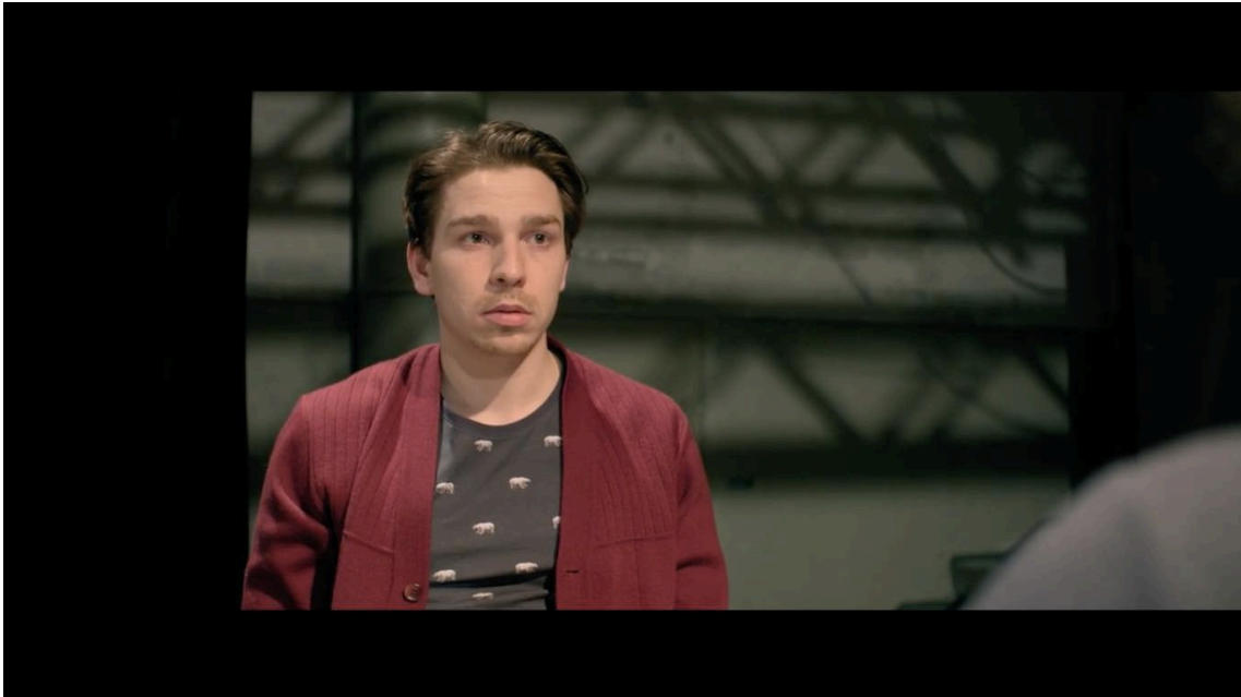
Figure 10:

I de första versionerna av klippet var det väldigt utdraget stunden Iris och Leo ser på varandra och klipptes fram och tillbaka mellan dem vilket resulterade i en lite obekväm känsla och antiklimax då den sekvensen inte hade någon dialog utan bara blickar. Sekvensen hade behövt vara kortare för att lämna ett så kallat mer öppet slut var vi inte skriver tittaren på näsan. Till slut blev scenen ändå helt fungerande trots alla utmaningar på inspelningsplatsen. Allt kunde vi förstås inte fixa i postproduktionen men i den slutliga versionen kändes missarna mindre synliga.