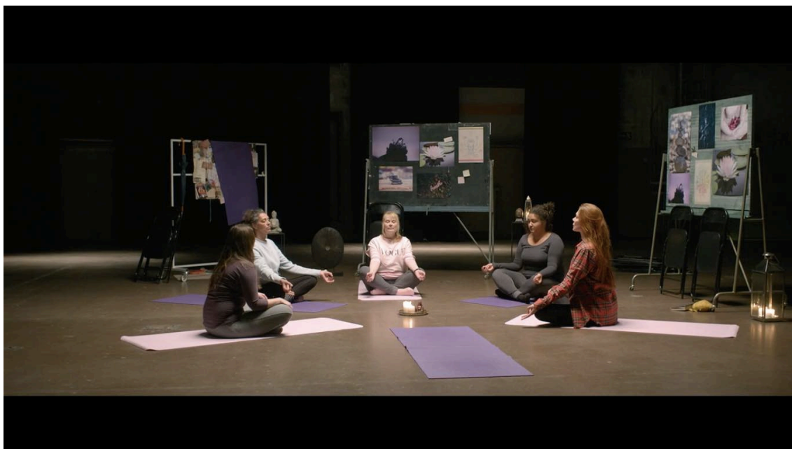
Figure 8: Stödgruppen omvandlad till yogastudio.

direkt istället för någon liten entré pga. att det både visuellt fungerade bättre men också för att avstånden skulle vara kortare och Iris hade möjlighet att reagera på hans röst.