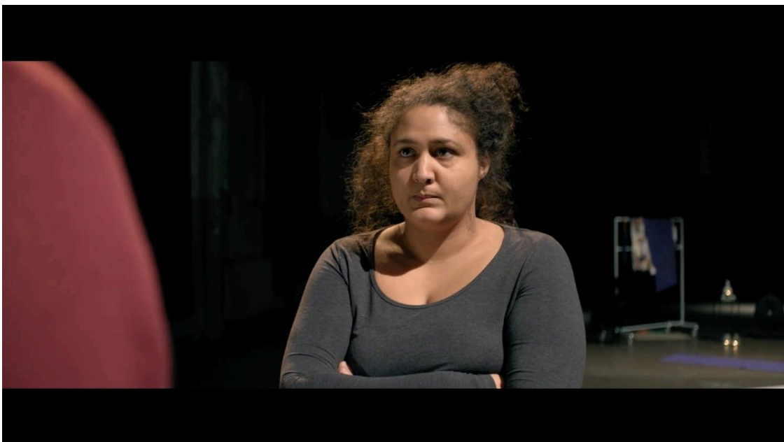
Figure 11:

I de första versionerna av klippet var det väldigt utdraget stunden Iris och Leo ser på varandra och klipptes fram och tillbaka mellan dem vilket resulterade i en lite obekväm känsla och antiklimax då den sekvensen inte hade någon dialog utan bara blickar. Sekvensen hade behövt vara kortare för att lämna ett så kallat mer öppet slut var vi inte skriver tittaren på näsan. Till slut blev scenen ändå helt fungerande trots alla utmaningar på inspelningsplatsen. Allt kunde vi förstås inte fixa i postproduktionen men i den slutliga versionen kändes missarna mindre synliga.