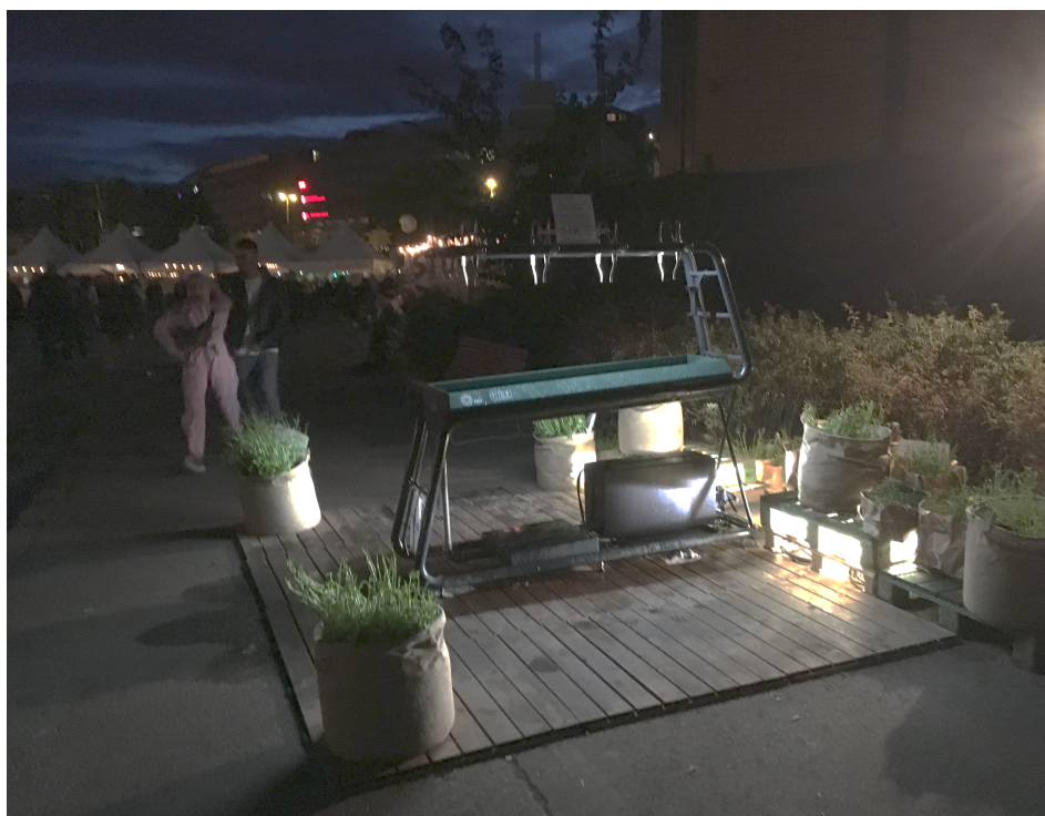
Kuva 3. Houkutteleva vesipullojen täyttöpiste Flow Festivalilla.

Festivaalialueella on panostettu kestävyuden viestimiseen kävijöille julisteilla, jotka tiedottavat mm. Sustainable Meal -hankkeesta. Kestäviä tekoja on myös tehty houkutteleviksi, kuten esimerkiksi vesipullojen täyttöpiste yhteistyönä Helsingin seudun veden kanssa (Kuva 3).