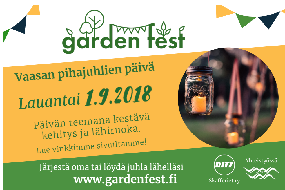
Kuva 5. Pohjalaisessa julkaistu mainos tapahtumaviikolla.

Markkinoinnissa yritettiin nostaa esille kestävä kehitys, mutta samalla painottaa, että tapahtuman järjestäjällä on vapaat kädet järjestää omanlainen juhla. Päädyimme valitsemaan kestävä kehityksen ja lähiruokan päivän teemoiksi (Kuva 5), ja mainostamaan verkkosivuilla saatavaa lisätietoa. Näin toivottiin, että kynnyksen tapahtumien järjestämiseen pysyisi tarpeeksi matalana, eikä kestävyys tuntuisi ylittämättömältä vaatimukselta. Verkkosivuilla kommunikointiin kestäviä konsepteja sekä järjestäjille että kävijöille helpoin vinkein, jotka olivat helposti luettavissa, kun he käyttivät sivua löytääkseen juhlat.