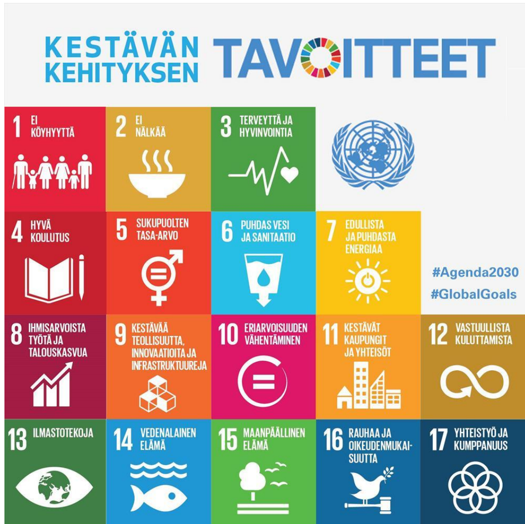
Kuva 1. Agenda 2030:n tavoitteet. /7/

Ohjelma sisältää 17 tavoitetta vastuullisesta kuluttamisesta nälänhädän poistamiseen. Kaikki tavoitteet ovat sitovia kansallisella tasolla, mutta niiden saavuttamiseksi 2030 mennessä tarvitaan yhteistyötä yhteiskunnan eri tasoilla. /7/