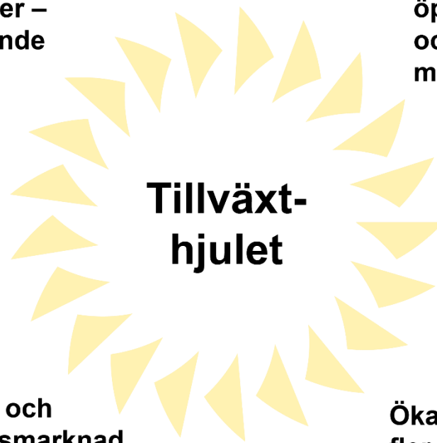
Figur 1. Tillväxthjulet. Antoni 2015.

Att satsa på kultur i olika former gör att det skapas en aktiv stad och miljö. Kultur och kreativitet kan inte tvingas fram genom lagar och regler, men genom att skapa goda förutsättningar för invånare att mötas och uttrycka sig kommer kreativiteten att vidgas och tillväxten kan fortsätta vara en positiv kraft. (Antoni 2015).