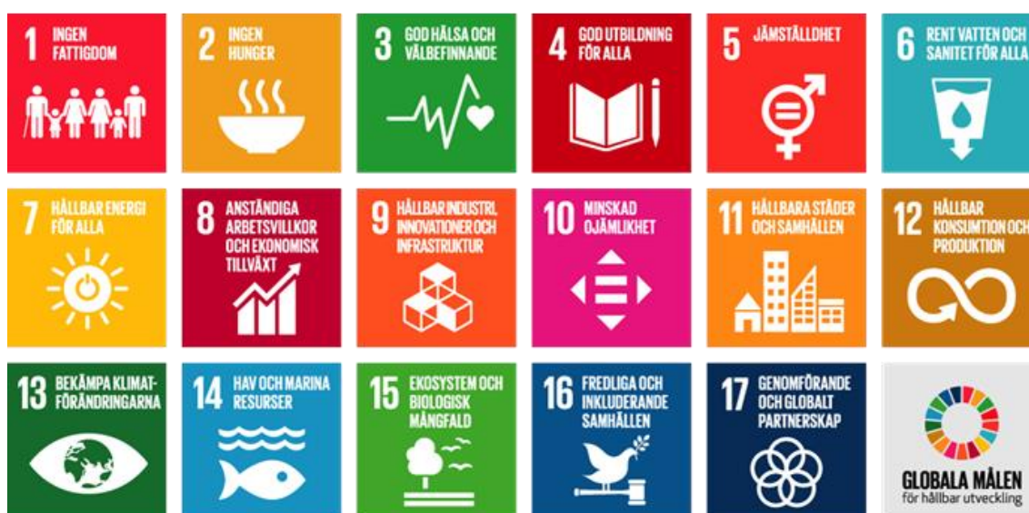
Figur 4 Agenda 2030 Regeringskansliet/FN 2015.

Målsättningarna inom Agenda 2030 är starkt implementerade i Förenta Nationernas organisation för utbildning, vetenskap och kulturs (förkortat UNESCO) verksamhet. UNESCO jobbar för samarbeten mellan nationer, att främja kunskap om kulturarvet genom hållbar utveckling men också ge människor rätt till frihet och utbildning. (UNESCO 2019)