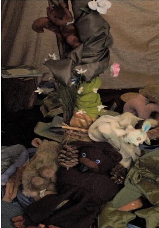
Kuva 3: Satumetsässä käytettiin monenlaisia käsinukkeja

avulla, ja näin reggiolaisuuden hengessä etsivät aktiivisina toimijoina vastauksia heitä pohdituttaneisiin kysymyksiin yhdessä toisten kanssa.