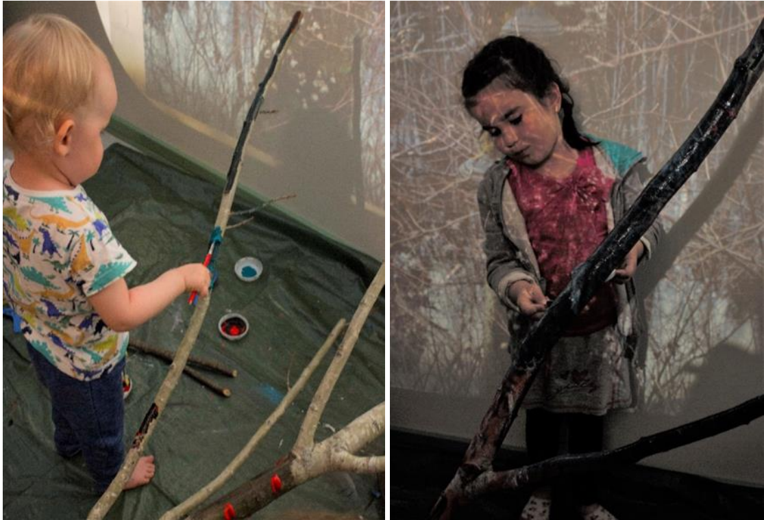
Kuvat 12 ja 13: Lapsia maalamassa taikapuuta. Seinille on heijastettuna kuvia oikeasta metsästä.

mielikuvituksellisuutta. Maalatessa he pohtivat, kuka metsässä asuu ja mitä kaikkea ihmeellistä puuhun voisi alkaa kasvamaan.