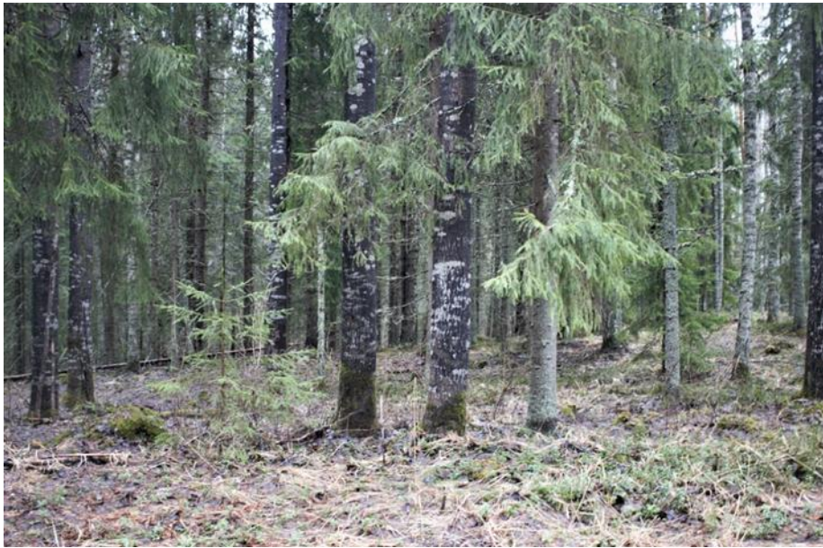
Kuva 8: Keskellä vasemmalla olevan Haavan latvusto päätyi projektin puuksi

Lehtori Vuori oli kiertänyt metsää ja etsinyt harvennettavan puukohteen. Metsässä valikoitiin tarkasti, mikä yksilö kaadetaan. Tarpeetonta puun kaatamista haluttiin välttää. Suuri haapa kasvoi liian tiheässä muiden kanssa ja oli siksi valittu kaadettavaksi (kuva 8). Kyseinen haapa kaadettiin harvennussyistä. Kasvupaikka ei ollut paras mahdollinen, koska sen lähellä kasvoi muita puita. Näin tämän haavan latvusto päätyi satumetsä-projektiin taikapuuksi. Puun kaatamisesta ja sen tekniikasta otetut useat kuvat ja puun kaatumisen videot herättivät lapsissa paljon mielenkiintoa (kuvat 9, 10 ja 11).