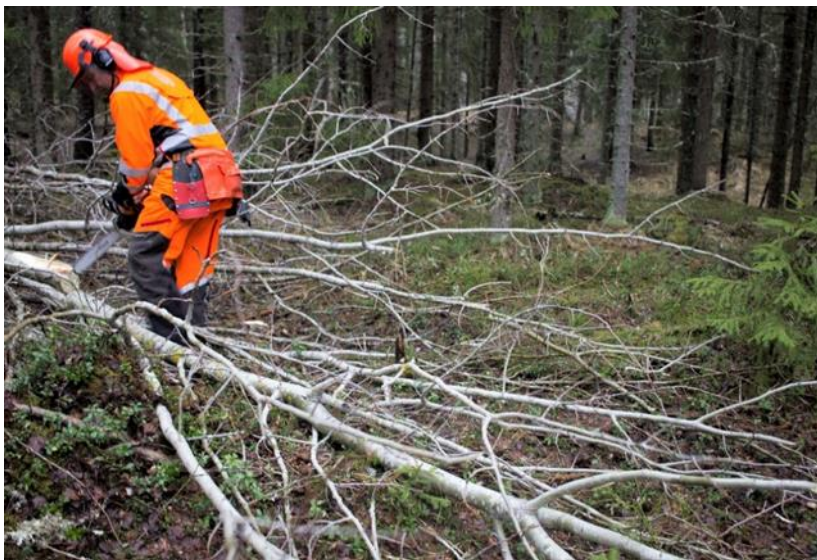
Kuvat 9, 10, ja 11: Vaiheita puun kaatamisesta