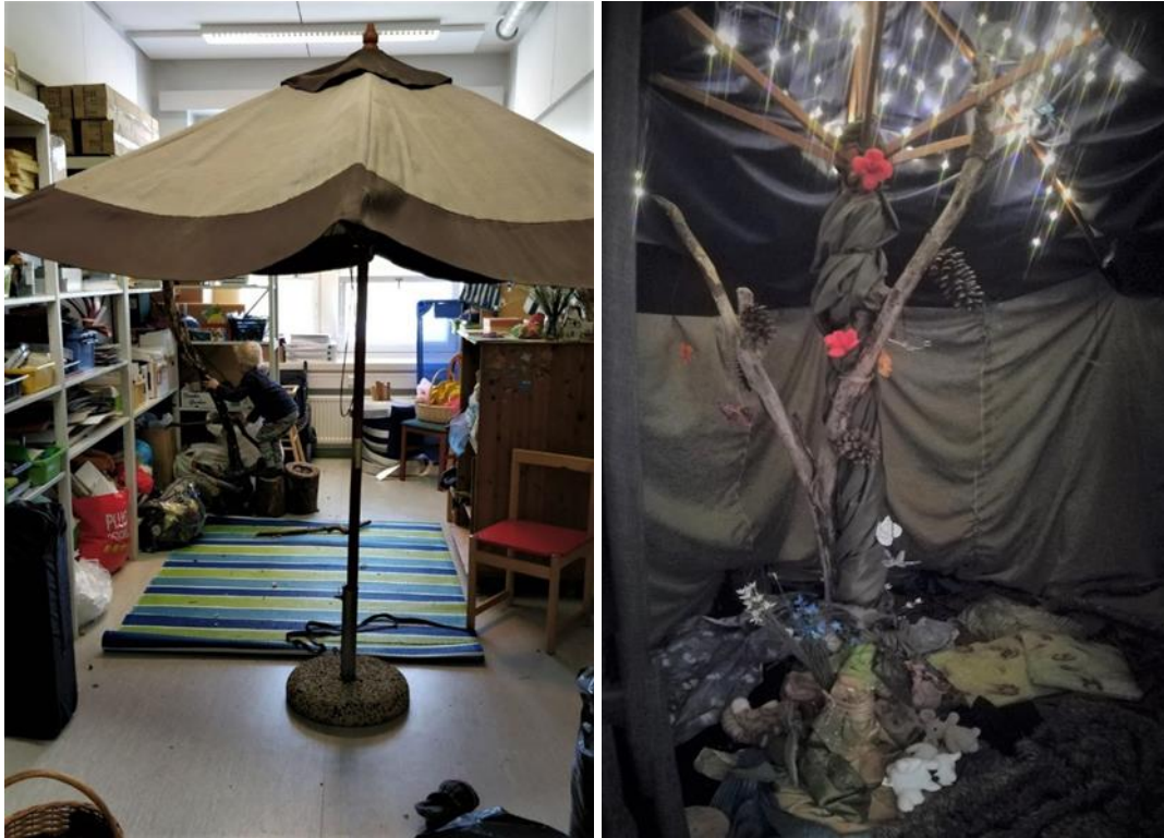
Kuvat 4 ja 5: Varastotila ennen ja jälkeen. Metsä rakennettiin isoilta osin teltan sisälle

varasto katosi kankaiden piiloon. Kun seinät olivat koossa, alkoi lasten kanssa satumetsän rakentaminen. Metsä oli muokattavissa koko projektin ajan ja se muokkaantuikin paljon.