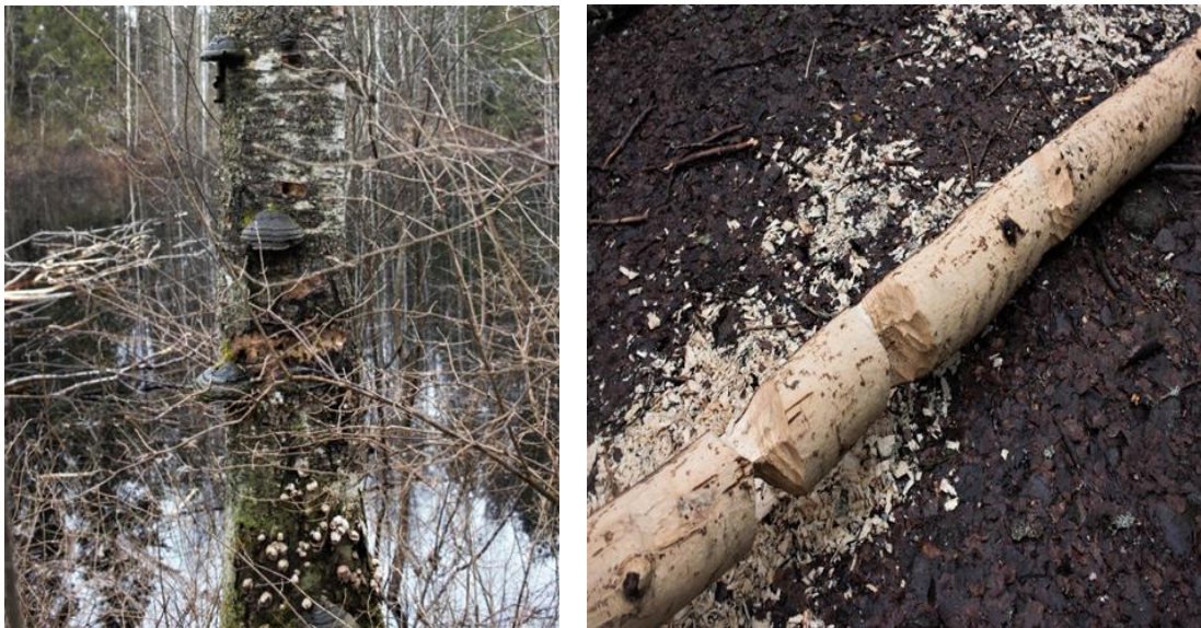
Kuvat 6 ja 7: Sienikasvustoa puun rungossa, majavan järsimä puunrunko

Luonnosta otetut valokuvat heijastettiin satumetsän seiniin projektorilla. Tämä toi huoneeseen moniaistillisuutta sekä uusia syvyyksiä. Lapset pääsivät pohtimaan sekä tutkimaan, mitä kuvissa näkyy. Lapset oivalsivat hienosti kuka oli mahtanut kuvan puun järsiä (Kuva 7) ja mitä toisen puun rungossa kasvaa tai mahdollisesti asustaa (Kuva 6). Lisäksi kuvat herättivät paljon keskustelua ja kertomuksia lasten omista metsäkokemuksista. Turvallisuussyistä lapsia ei voitu ottaa mukaan puunkaatoon, mutta yhdessä lasten kanssa käytiin läpi puun kaatoon liittyvät turvallisuusasiat ja ne kiinnostivatkin heitä kovasti.