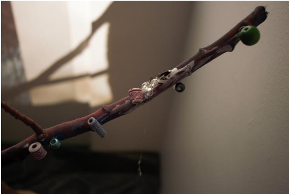
Kuva 18: Lopulta taikapuuta koristeltiin muun muassa helmin

Lapset pohtivat vielä askartelun jälkeenkin, mitä voisivat oksiin vielä laittaa kasvamaan. Yhdessä he ihastelivat toistensa tekemiä töitä ja oppivat kehumaan muiden aikaansaannoksia. Yhdessä tehty puu symboloi päiväkodin henkeä ja jokaista sen yksilöä. Myöhemmin myös vanhemmat saivat lisätä koristuksia puuhun päiväkodin kevätjuhlassa. Lapsille puun koristelu ja hienon tuotoksen esittely vanhemmilleen oli tärkeää.