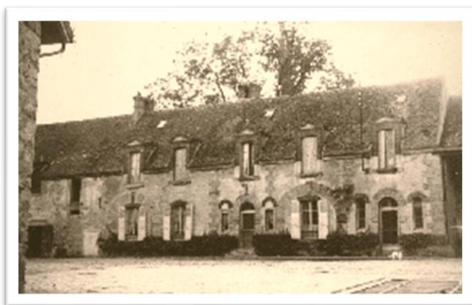
Ferme-de-la-Fromagerien 1900, Chailly-en-Bière

(Chailly en Bière Fayë, Ferme de la Fromagerie)