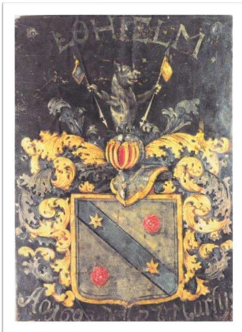
Lohjelm-vaakuna 1709, tekijä/alkuperä tuntematon