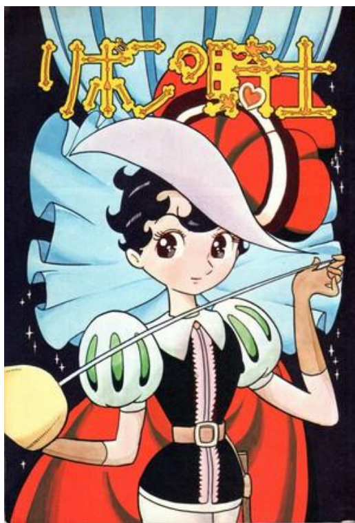
Sapphire 1953, Osamu Tezuka