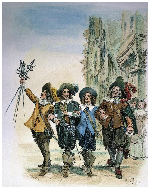
Les Trois Mousquetaires 1800, Maurice Leroy