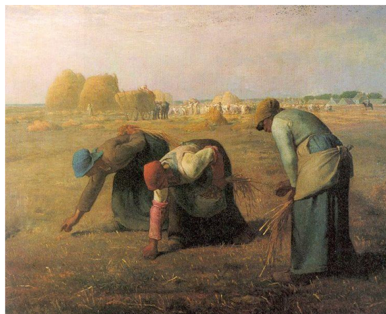
Tähkänpoimijat 1857, Jean-François Millet