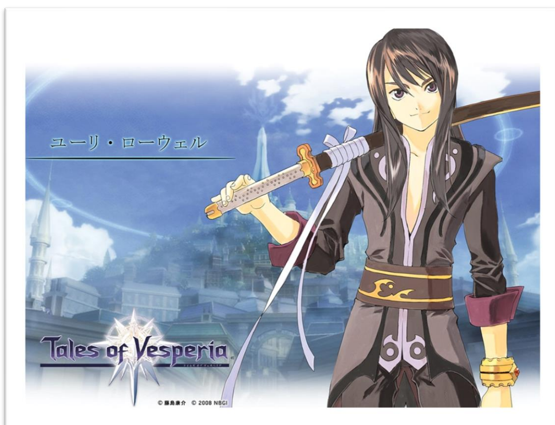
Yuri Lowell 2008, Namco Bandai